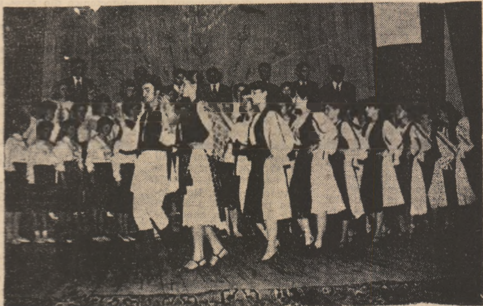
În cadrul festivalului, formația de dansuri populare a cooperativei „Rețenatul“ a avut o frumoasă prezență.