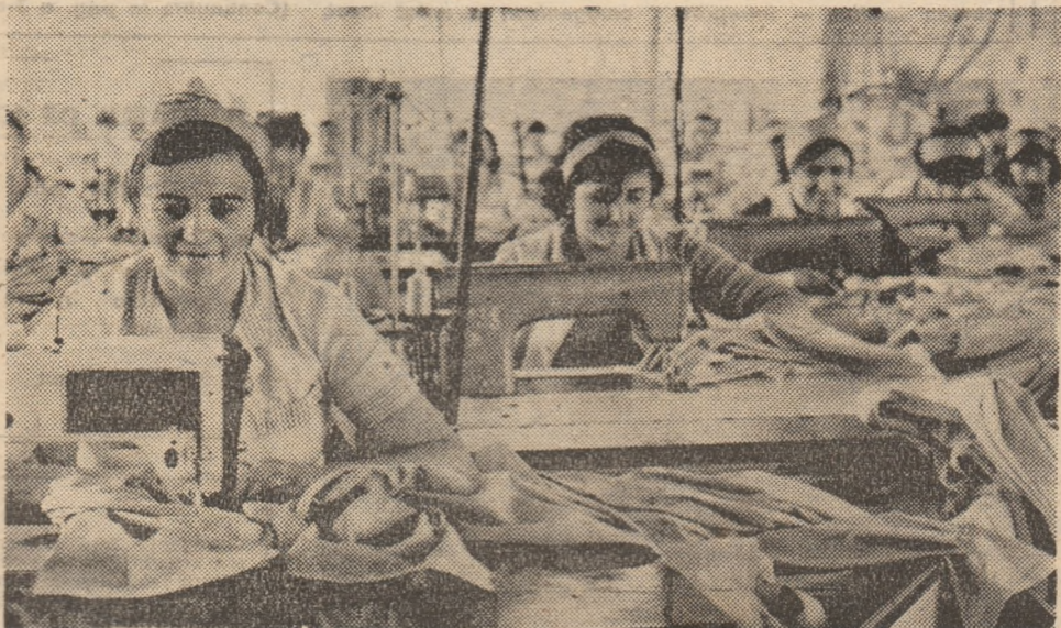
In secția de producție a întreprinderii de confecții Vulcan, harnicele muncitoare — fiice și soții de mineri — realizează numai produse de calitate.