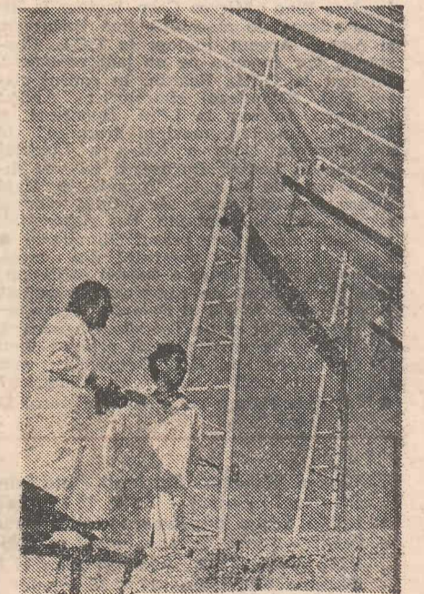
U.R.S.S. „A pune spiridușul galben (soarele) la hamul energetic” — astfel își definește misiunea specialistii de la Institutul pentru energia solară al Academiei de Științe din R.S.S. Turcmenei