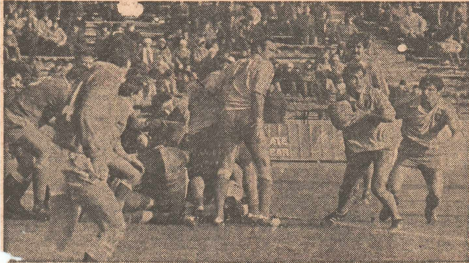
Pe treisferturi, tricolorii au fost de neoprit

● „Echipa României bate la porțile Turneului celor 5 națiuni” („Daily Telegraph”) ●