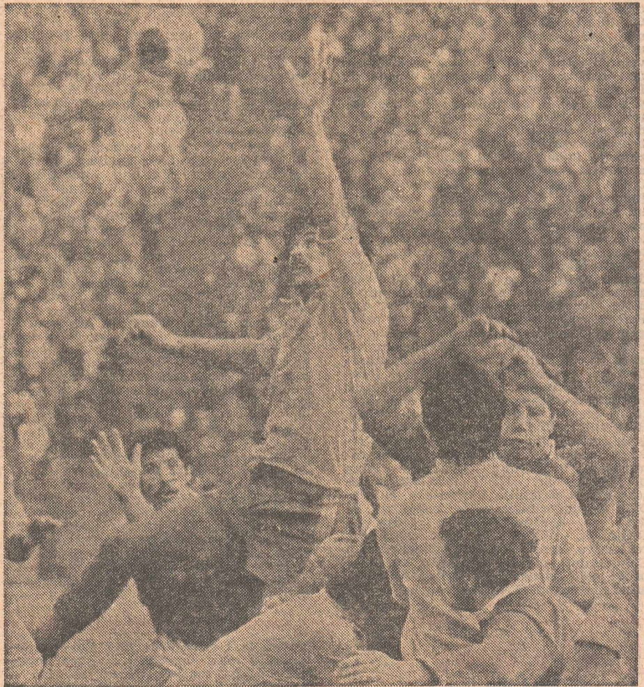
„Tușa” noastră a fost tot timpul mai bună