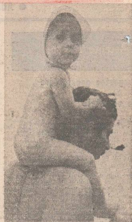
Fotoreportaj de PAUL AGARICI ■