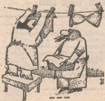
După Krokodil — U.R.S.S.