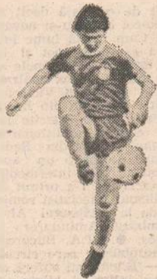
La 34 de ani, Puiu Iordănescu e de-o vîrstă cu Jordao și Nene! Il vom revedea jucînd?