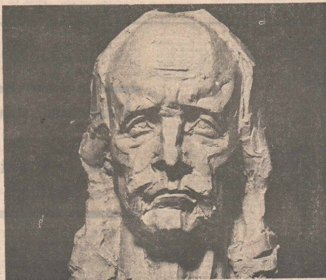
Sculptură de ION VLASIU

Horia — un om care a învîrtit roata istoriei