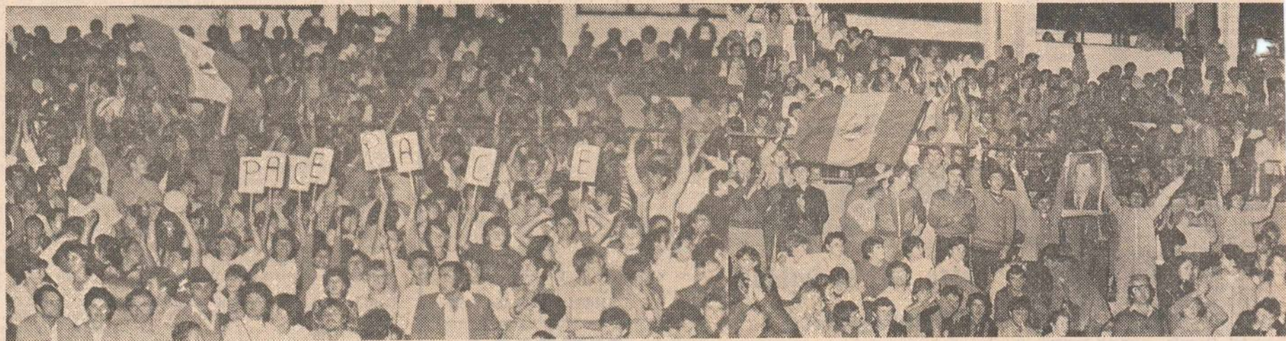
La Alba Iulia, „istoria-ntrăgă cu lupte și jertfe trăiește-n unirea de azi”.