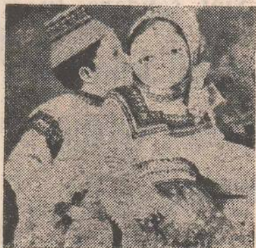
Ilustrație de TEODOR BOGOS

învîgătorii își nimicesc adversarii sau îi ascrvesc prin indoctrinarea lor cu o „partitură scrisă pentru ci anume”. Indivizi și popoare alegă după putere și lupta pentru ea transformă pămîntul într-un cîmp de bătălie împințit de cadavre. Toți rivnesc să capete roluri, „foiesc speriați de libertatea de-a fi anonimi”. Lipsa criteriilor metamorfozează istoria într-o petrecere cu măști, unde „idolli sint muritori de rînd” și gesturile se comit în zadar, în absența valorilor certe care să le dea acoperire. Poetul ironizează „marile gesturi”, evocă batjocoritor „gloria busturilor goale de gips” iar în Plîns și Orgoliu arată cît de vremelnice și iluzorii sint emblemele puterii: „Pămîntul cere oseminte / de la gazele și de la lei...” Martiri, eroi și tirani trec de-a valma într-o defilare grotescă. Oamenii se preschimbă în ființe damnate care pribegesc, războiaie se declanșează și se sting la fel de neașteptat, călăii urții odinioară sint adorați: „S-a ascuns în cuirase / de bronz, de granit și de aur / cu gesturi și priviri de apostol”. Execuțiile se țin lanț, astfel încît „în veacul acesta aproape sfinți / nu mai e rug slobod / pentru Jan Huss”. La capătul fiecărui destin se poate profila „un butuc într-o șit”. Întimplările vieții par dictate