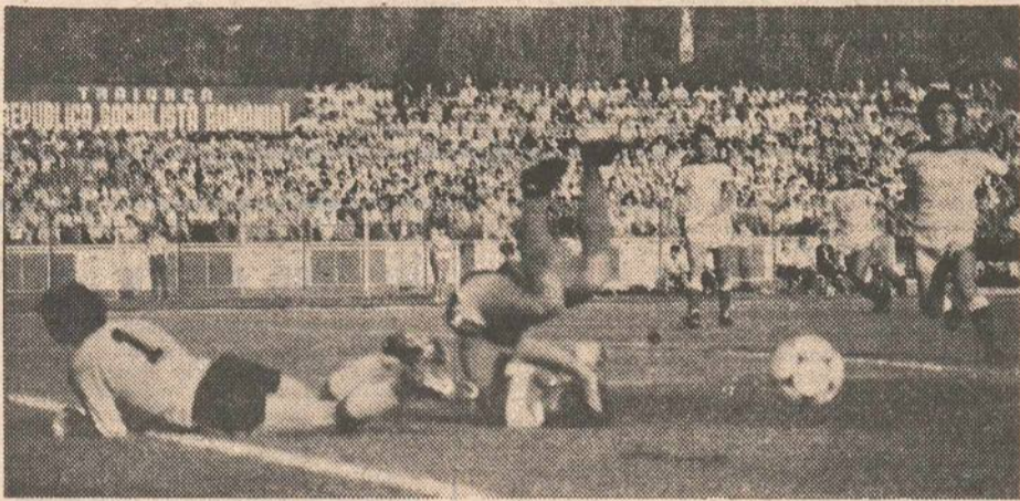
Momente de fotbal spectaculos, eficient pe stadionul Dinamo alese și memorate de Paul Agarici