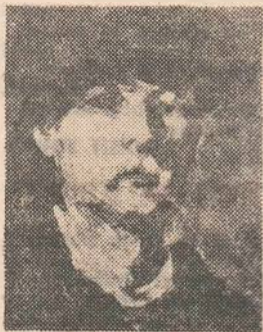
Nicolae Grigorescu Autoportret