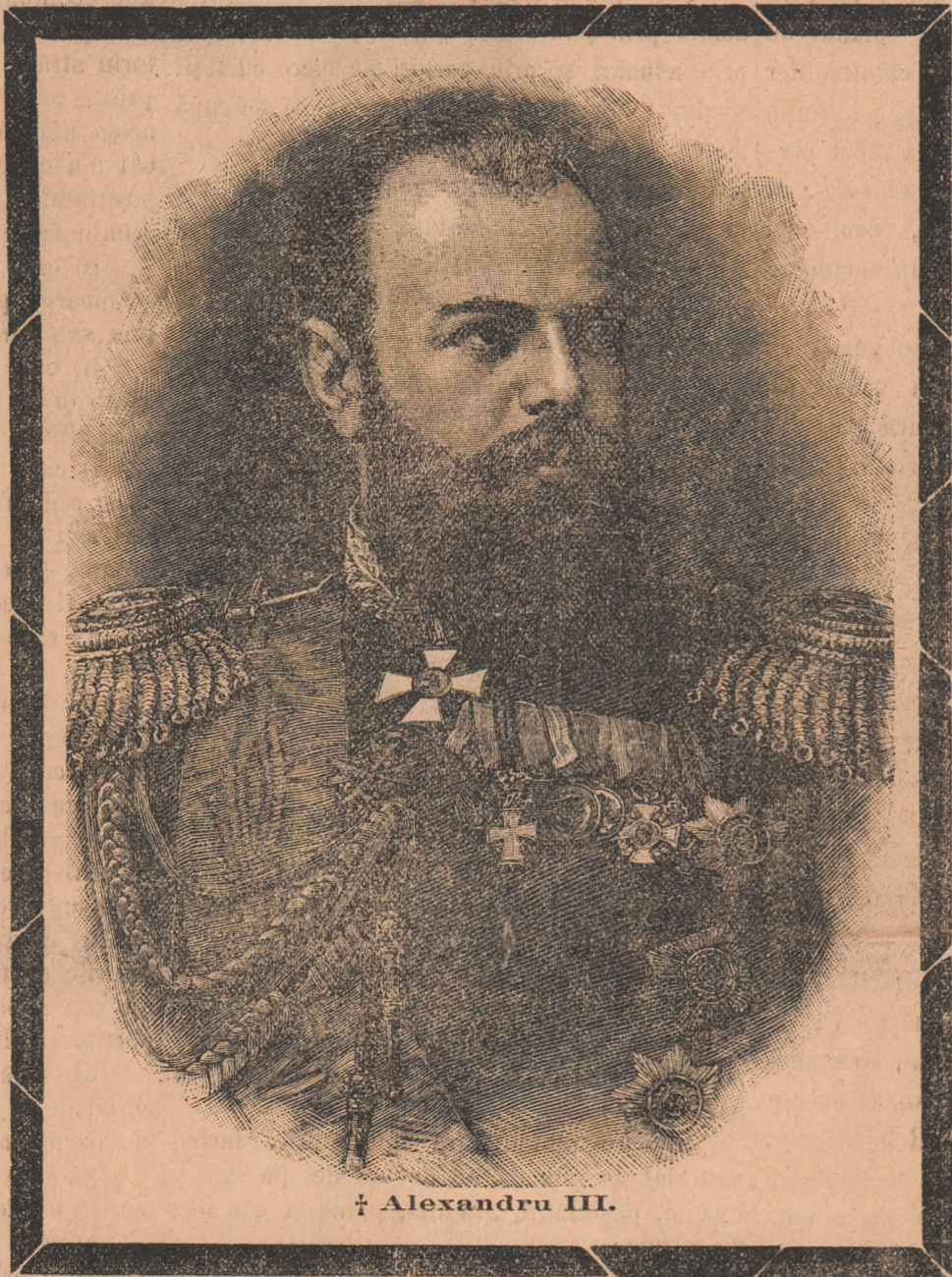
† Alexandru III.

Intrevederea împăratului Alexandru din 15 Septemvre 1884 cu împăratul Wilhelm și Francisc Iosif in Skierniewice, și visita ce acesta a făcut-o împăratului Francisc Iosif in orașelul din Moravia, Kremsier, la 25 August 1885, lăsau să se intrevadă, că aceste 3 puteri