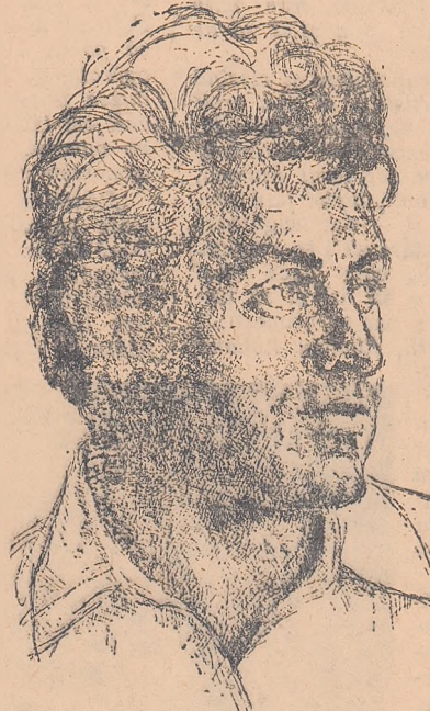
Arieșului, "Prin muștii Bihariei".

Una din caracteristicile poeziei lui Baconsky nu se pare puterea de evoluție a atmosferei care uneori acompaniază cîntecul solo.