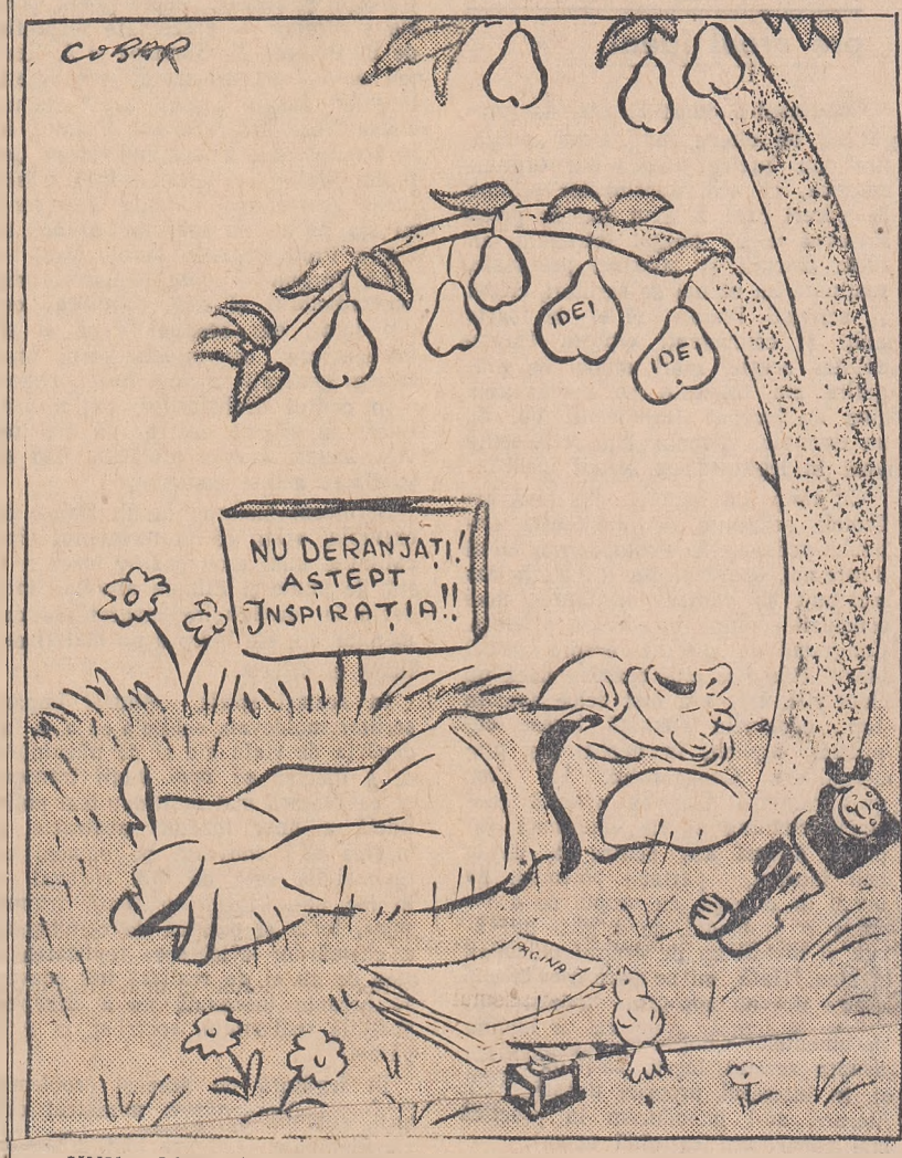
UNUL CARE APLICĂ ZICALELE...