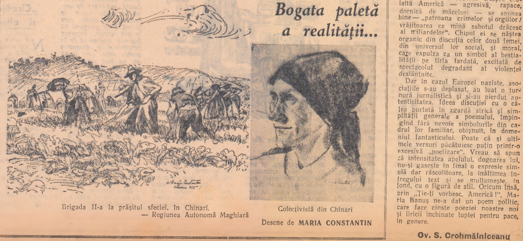
Brigada II-a la praștialul stelei, în Chinari. — Regiunea Autonomă Maghiară. Colectivistă din Chinari. Desene de MARIA CONSTANTIN