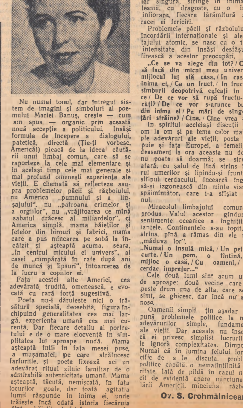
Pe marginea poemului „Ți-ți vorbesc, Americă” de Maria Banuș.