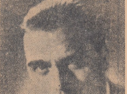
Desen de ROSS

Citeva date. „Sarea e dulce“ este primul volum dintr-un ciclu intitulat modest: „Insemnările și amintirile unui ziarist“. Acest titlu indică așa-