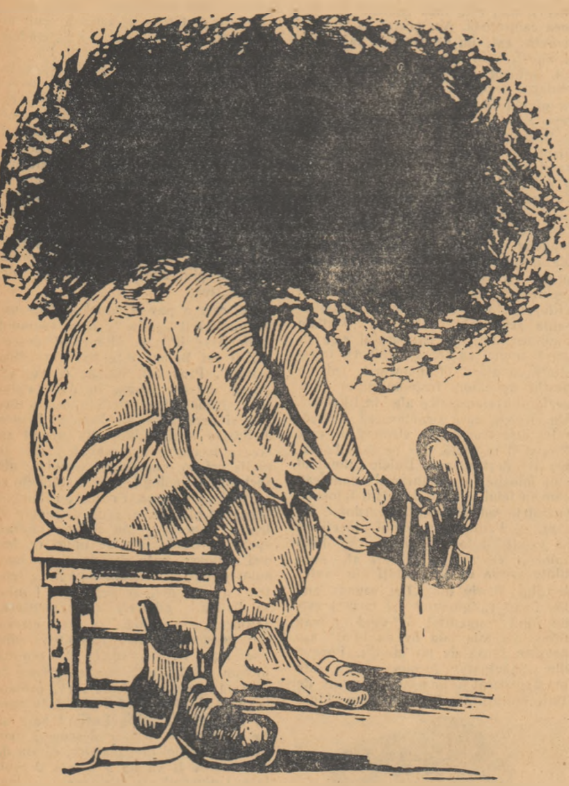
„S-a sculat cu noaptea-n cap”

sele pline de umor, de intuiție exactă a formelor de sugestie... „Ilustrează” Perahim. Cine nu sezișează această nu pricepe nici mobilul ar-