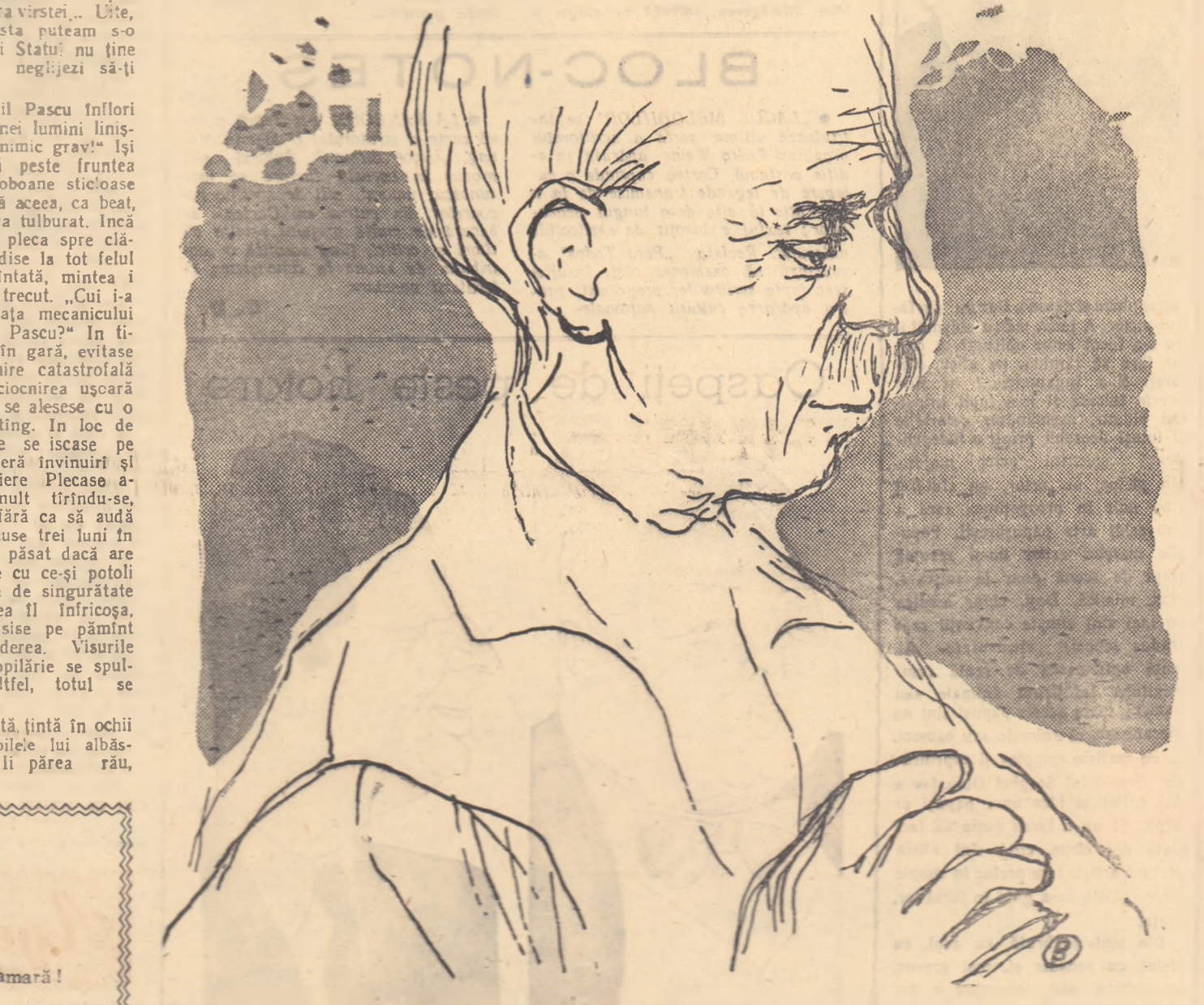
Desen de VALENTINA BARDU