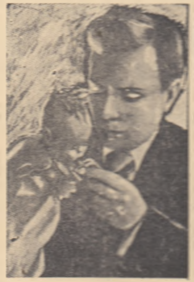
Sergei Obrazov este așteptat și de noi oameni cu total felicități...