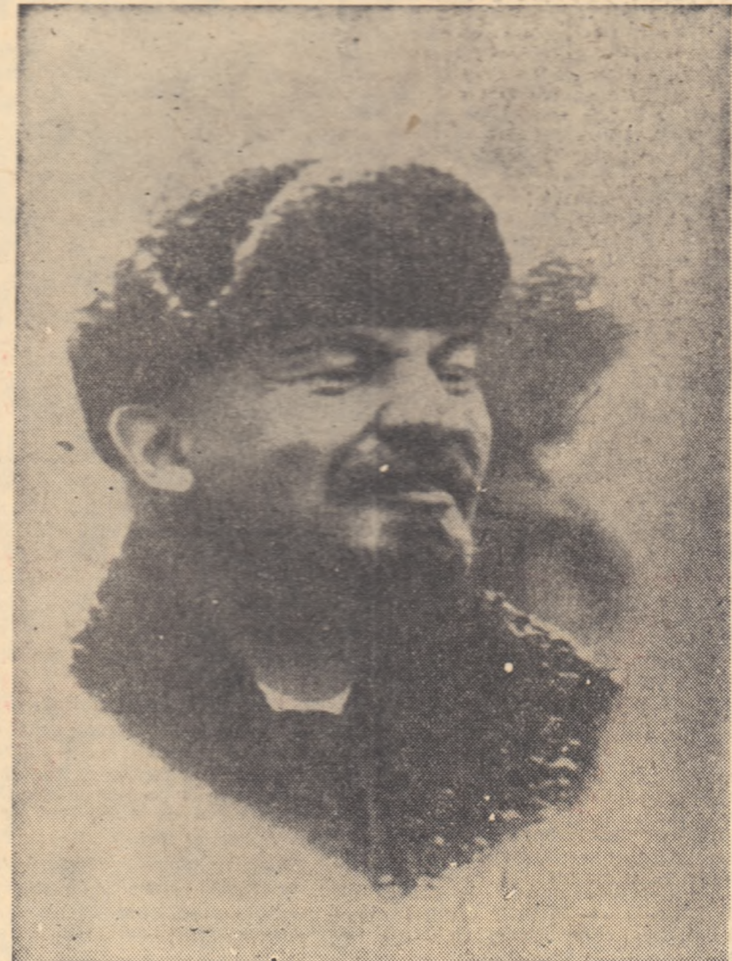
Lenin în noiembrie 1919