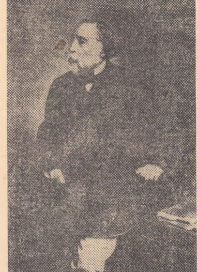
de Ion Ghica