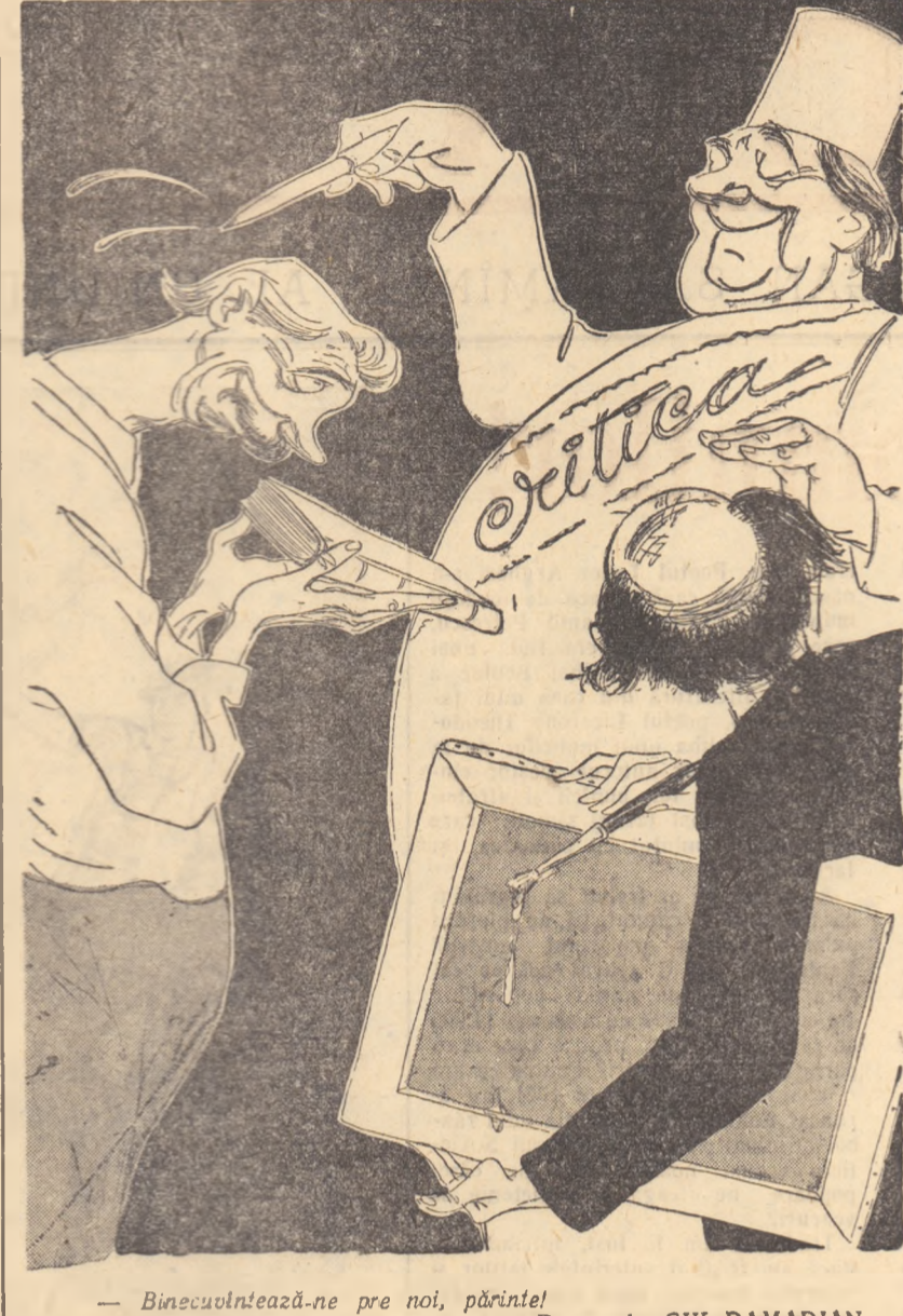
Binecuvîntați-ne pre noi, părinte! Desen de GIK DAMADIAN