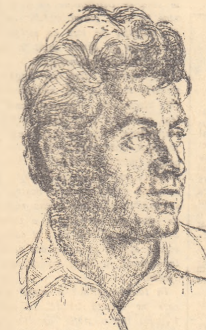
„Cîntec de seară”

reanaște neincetat, cucerind în valuri succesive viitorul. Floare tirzică ale toamnei simbolizează viața triumfătoare, cînd totul se pregătește de hibernare: ele plutesc „peste toamnă” și dau un sentiment de siguranță, de certitudine a vitalității naturii și a frumuseții care o însoțește („Imn către florile toamnei”). Toamna, în general, nu înfrîntă, ci predispoze la visare: are o chîră „vreme de visare” care „pătrunde” în poet. Viziunea e organică poetului și nu formală: „Eu nu mă tînguie către toamnă trist/Simt doar aici bogatul ei teaur—/Urst am fost s-apar și să exist /În timpul mare-al viselor de aur”.