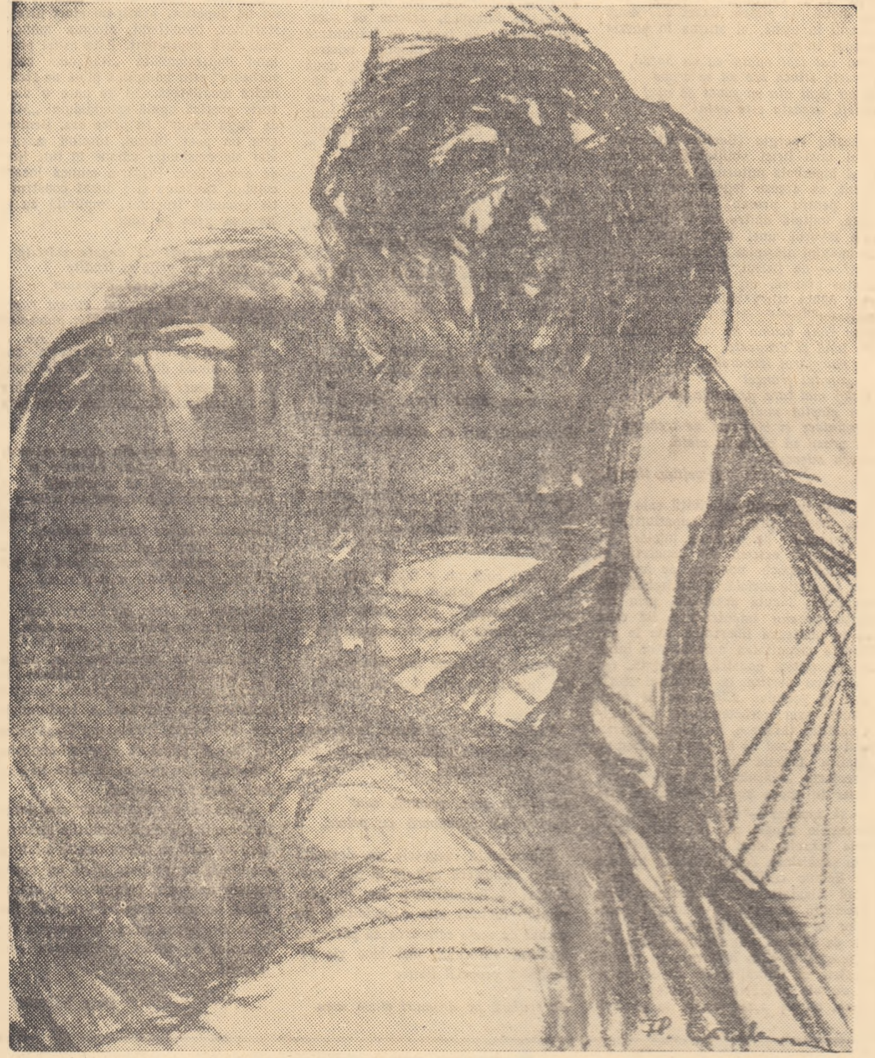
Desen de FLORICA CORDESCU

dacă nu-s rușii de față, în țară, mai știți ce se poate întîmpla? Avea dreptate cel cu șeful de post, că mîine se descuie șeful. „Hei, Florea, Florea, ziceai că vin rușii să ne scape. Au venit? Unde-s? Iote-i ia, cum stau la Prut, ne lasă ici de izbellite, iară noi... noi ăștia... care... săraci și amăriți... Săracul tot sărac, mîi Florea. Mîine, parcă văd: odată vin jandarmii și mă umplă pe sus, bine zi, ceau cei care ziceau: dezertor... Ce le pasă la boieri că eu... Și atunci? Aud? Sar atunci comuniștii să mă apere? Să-i văd: de unde sar?”