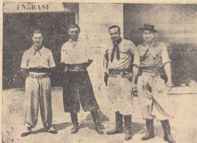
Un grup de gauchos din comuna unde s-a născut Guiraldes