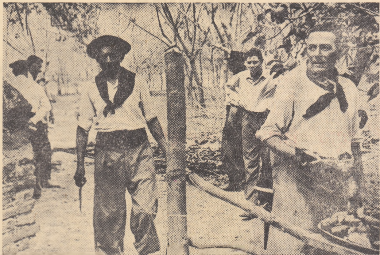
Gauchos prepară ospățul în amintirea lui Ricardo Guiraldes