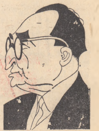
MIHAIL CUNELACHIS dramaturg (GRECIA)