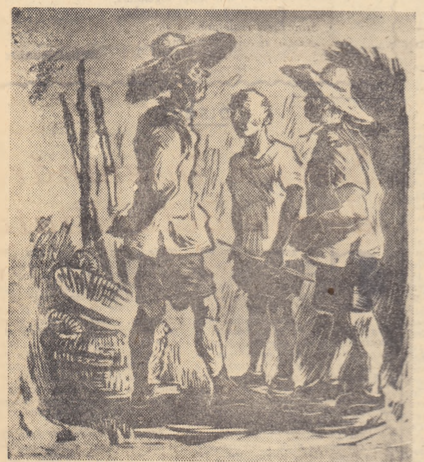
„Pescari” (gravură în linoleum)