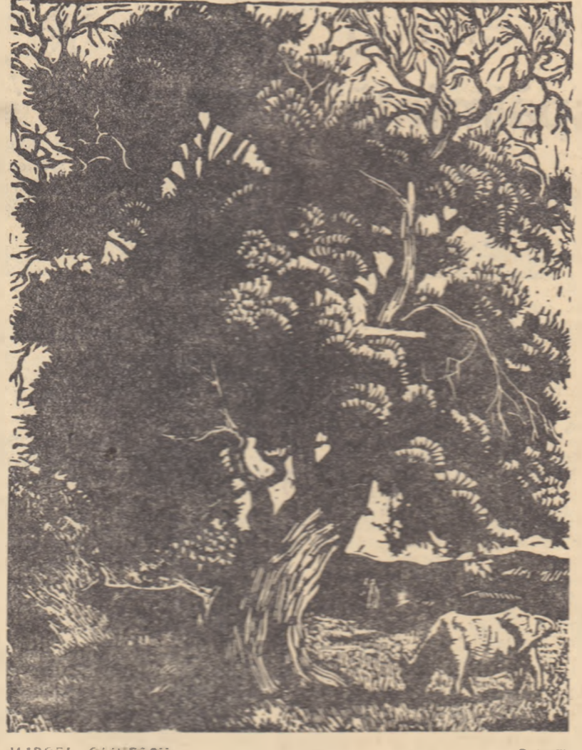
MARCEL OLINESCU „Peisaj”