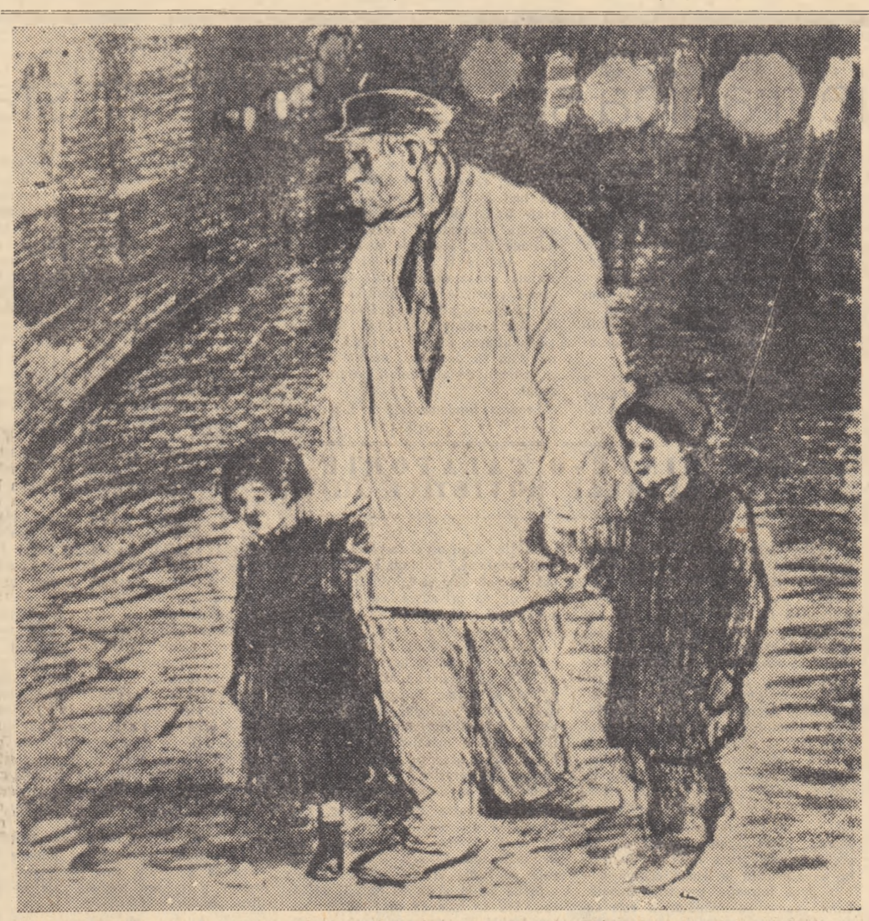
„Tătăcule, tu știi pentru ce s-a luat Basilia?”

Redactor-șef: Zaharia Stancu. Colegiul redacțional: Mihai Bănuț, Marcel Bredașu, Eusebiu Camilar, Paul Georgescu (redactor-șef adjunct), Eugen Jebeleanu, Eugen Macoveșcu, Ion Mihăileanu, V. Mindra (redactor-șef adjunct), Mihail Petroveanu (redactor-șef adjunct), Cicero Theodorescu, Ion Vițner.