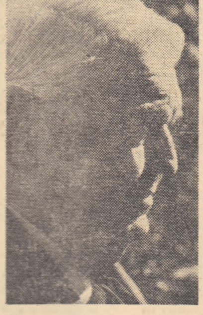
(Urmare din pag. 3)