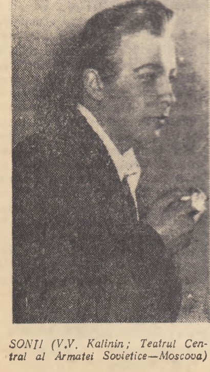
SONJI (V.V. Kalinin; Teatrul Central al Armatei Sovietice-Moscooa)

NOTE DINTR-O CALATORIE PRIN TEATRELE SOVIETICE (II)