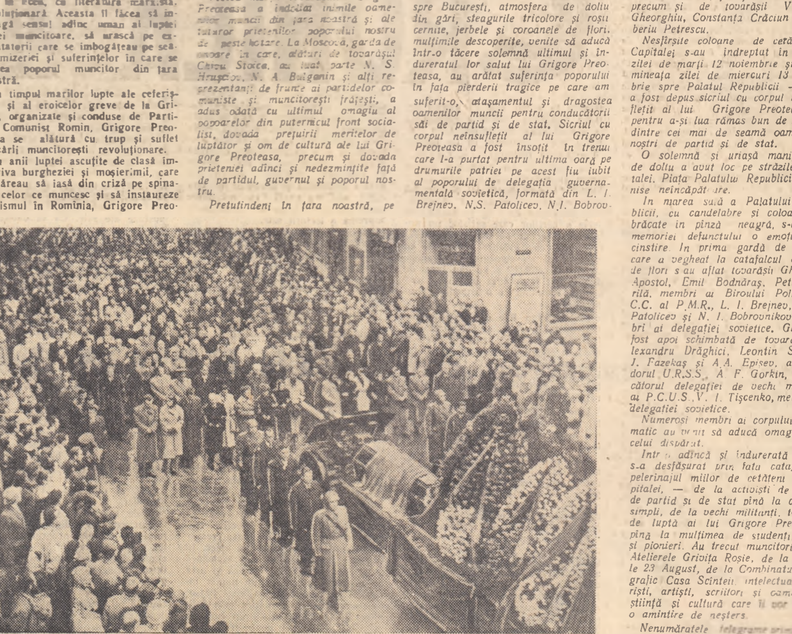
Corțegiul funerar, pe Calea Victoriei, în drum spre Cimitirul Militar, Ghencea