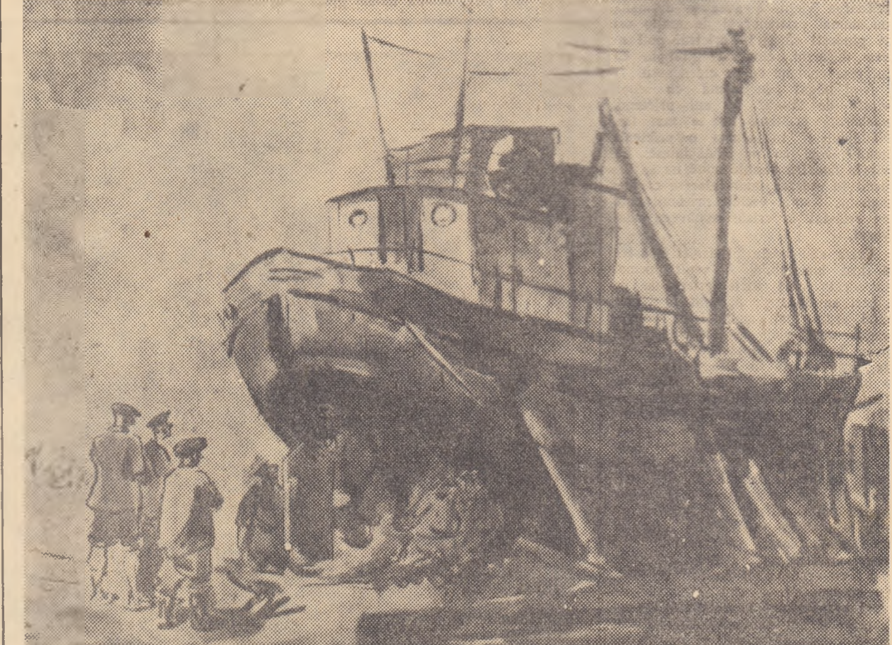
GM. IVANCENCO „Vas în reparație”