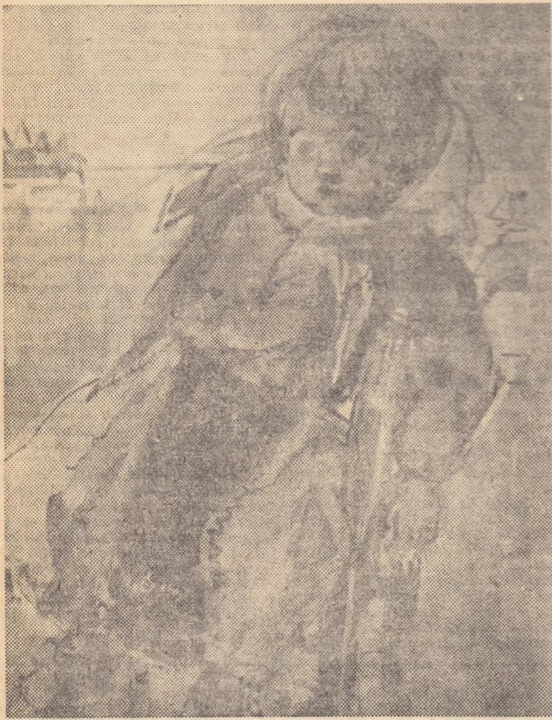
ANA ILIUT „Pe gânduri”