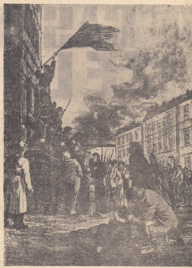
„Înălțarea drapelului roșu”