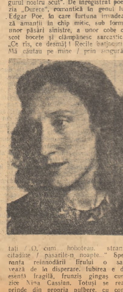
tal / O, cum hohoteau, straniu citadine / pasarile-n noapte... / Spaveza reînnoșării firului / o salvează de la disperare, tuberea de esență fragilă, frunzăriș gingaș cum zice Nina Cassian. Totuși se reaprinde din propria pulbere, cu con-

grozită și analitică în „Ce-i ce devoră” — descrierea semnelor ferocității e exactă — Nina Cassian reapeare ca autoare a „Muzeului de vechituri” ca moralistă. Poate poezia ce dă titlul volumului se apropie de modul ei propriu, expansiv. Procedul personalității scade însă tensiunea abandonului voluptuos al mării în îmbrățișarea vîntului, figurat fabulos, ca un călător ciudat în pălul căruia „pășări solenne se zbat”.