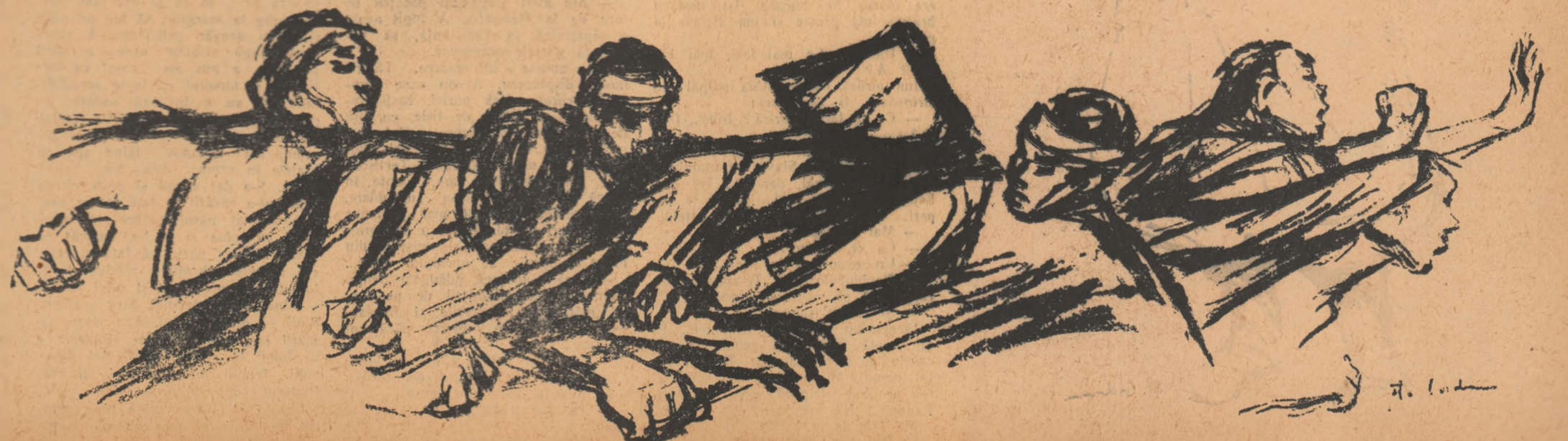
Ilustrații de Florica Cordescu