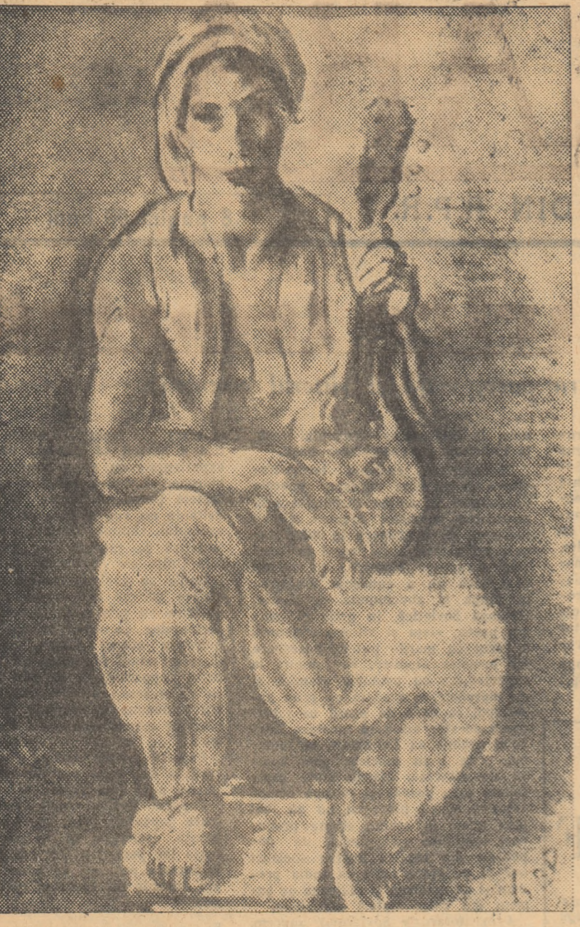
IOSIE, ISBR „Sîntărea” (desen)