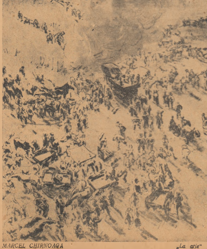
La arie (din seria "Bărăganul", litografie)