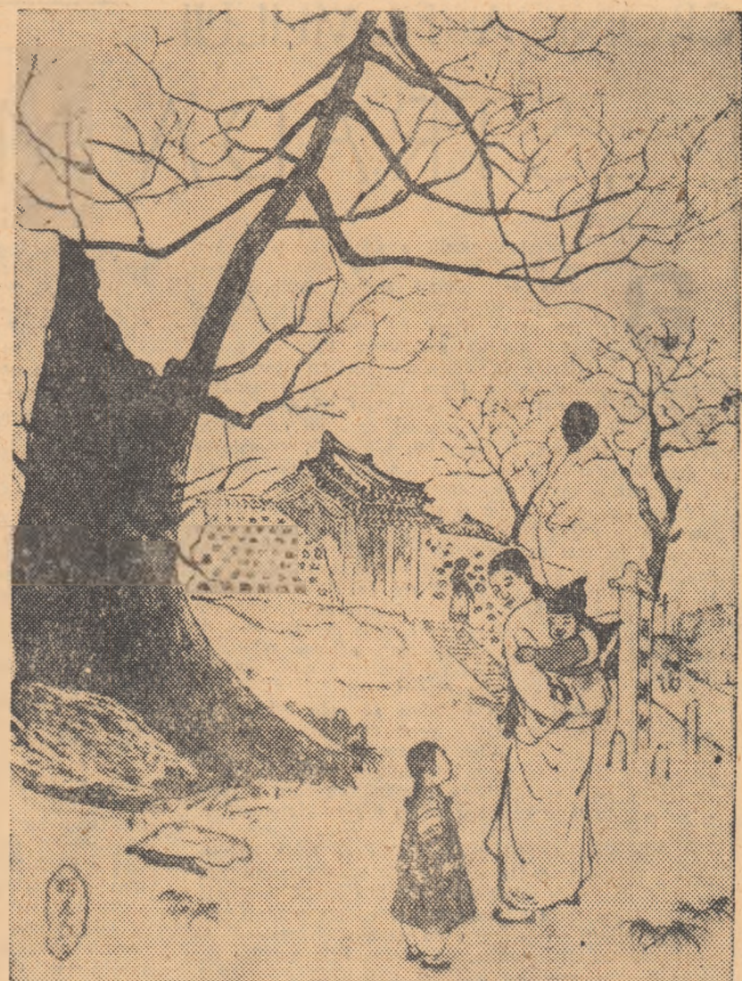
BIA UN SEN (Din Expoziția „Arta plastică în R.P.D. Coreeană”) „Primădoară”