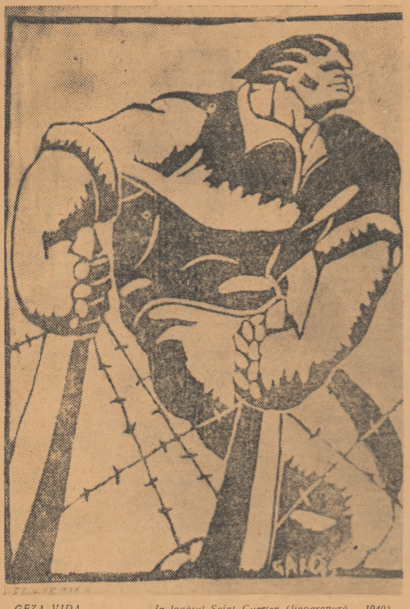
GEZA VIDA În lagărul Saint Cyprien (linogravură, 1940)