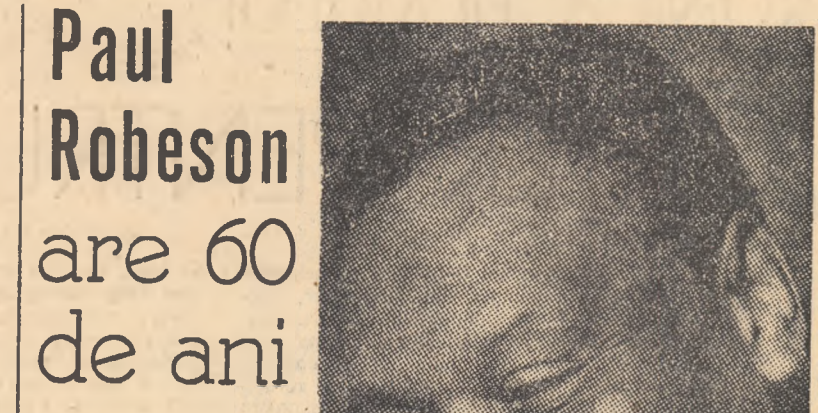
Paul Robeson are 60 de ani