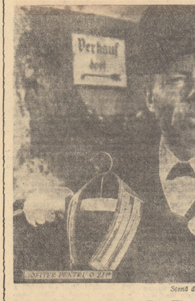
Scenă din film