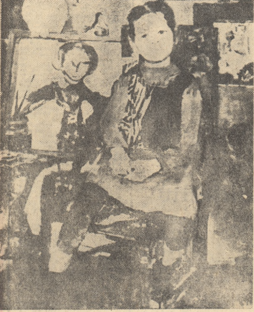
A. A. MILNIKOV (U.R.S.S.) „Fetiță în atelier”