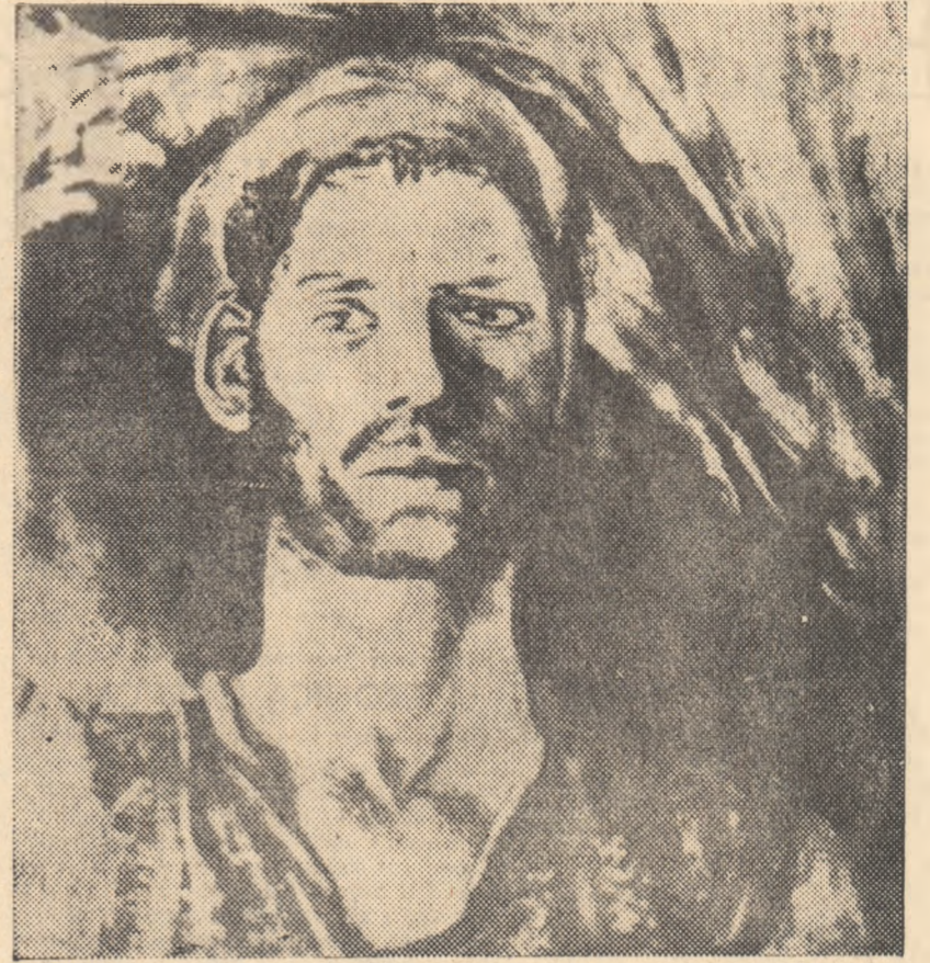
RENATO GUTTUSO „Miser”