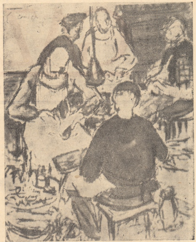
EUGEN CRĂCIUN „Într-o cooperativă meșteșugărească” (Proiect de compoziție)