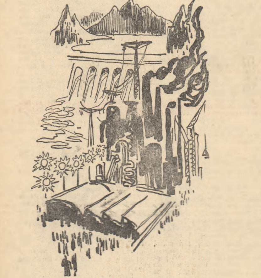
Desen de ROMEO VOINESCU

Prezent există o continuitate a marilor valori progresiste. Saltul calitativ îl oferă conținutul nou al vieții, surprinderea lui în accepția istorică concretă... Este clar că numai contemporaneitatea poate oferi astăzi un inepuizabil izvor de originalitate prin intenșiv și pasionantelor conținuturilor de viață pe care le cuprinde.