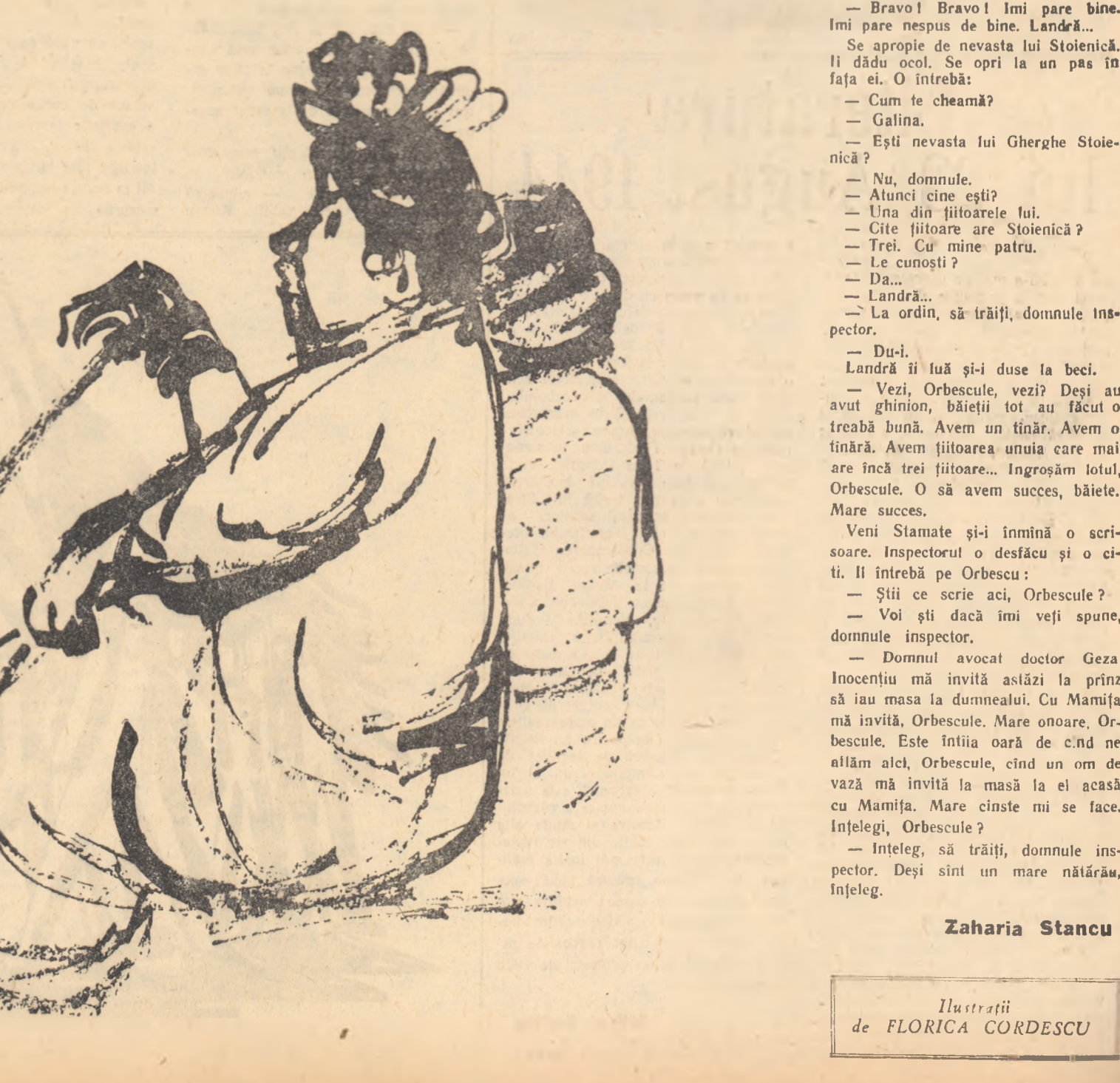
Zaharia Stancu Ilustrații de FLORICA CORDESCU

— Vor ieși dacă-i vom strînge cu usa, însă la proces vor nega. Vor spune că au declarat ce-au fost siliți să declare și au iscalit ca să scape de bătaie. — Ești și? Treaba tribunalului. Să se descurce cum vor ști. Însă în situația actuală tribunalul militar va ține seama de ceea ce va fi scris în dosarele încheiate de noi și nu de declarațiile pe care le vor face ei în instanța la îndemnul avocatilor... Ai înțeles, Orbecscule? — Am înțeles, să trăiți, domnule inspector. — Pricepi acum pentru ce fi-am zis că ești nătrău? — Procep, să trăiți, domnule inspector. — Am să-i spun și Mamiței că ai recunoscut că ești nătrău, Orbecscule