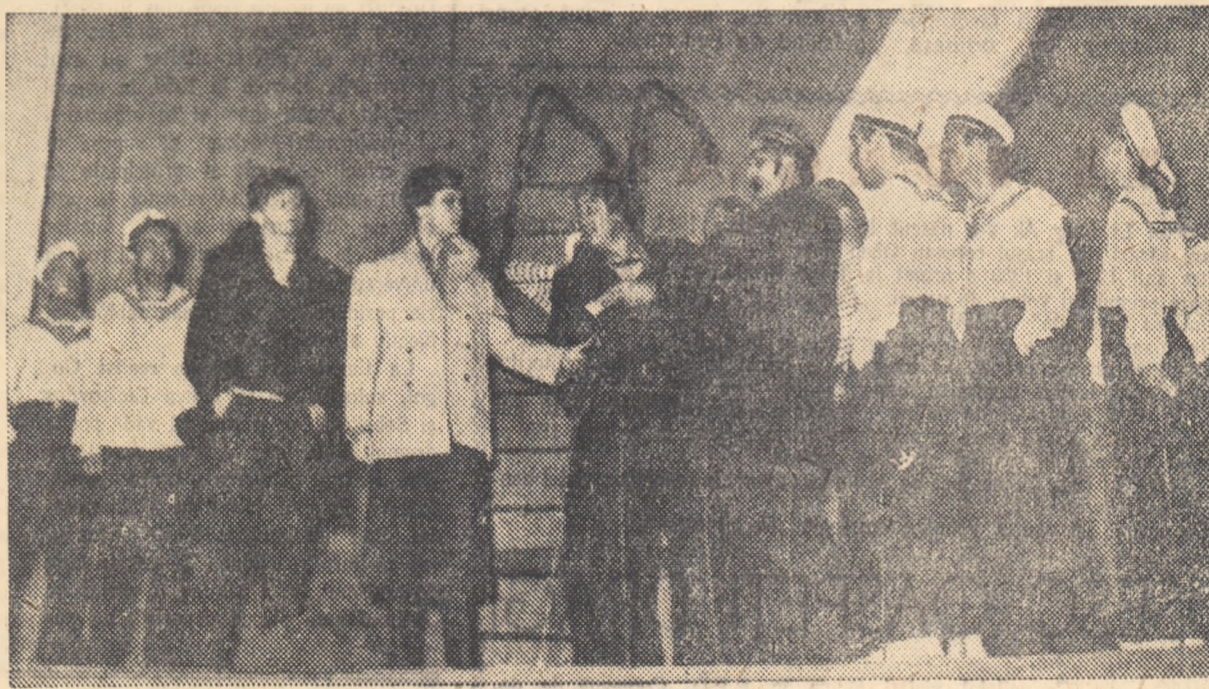
Scenă din actul I

Întreaga piesă este, de altmînteri, concepută în chipul unei lecții solenne și substanțiale despre eroism. Vișnevski adoptă, în acest scop, mijloacele dramei epice care avea să renască în deceniile următoare, devenind atât de necesară dramaturgiei realității-socialiste. Nu lipsesc din formațiunile prezentatorii naratiunii scenice, dar aceștia nu par dispuși să devină simpli povestitori, mai ales pentru că n-au cum să accepte o poziție obiectivă față de termenii vii ai dramei. Cei doi marinari, care nu figurează pe lista șefului de echipaj, alcătuiesc în primul rînd un comentariu liric care imprimă construc-