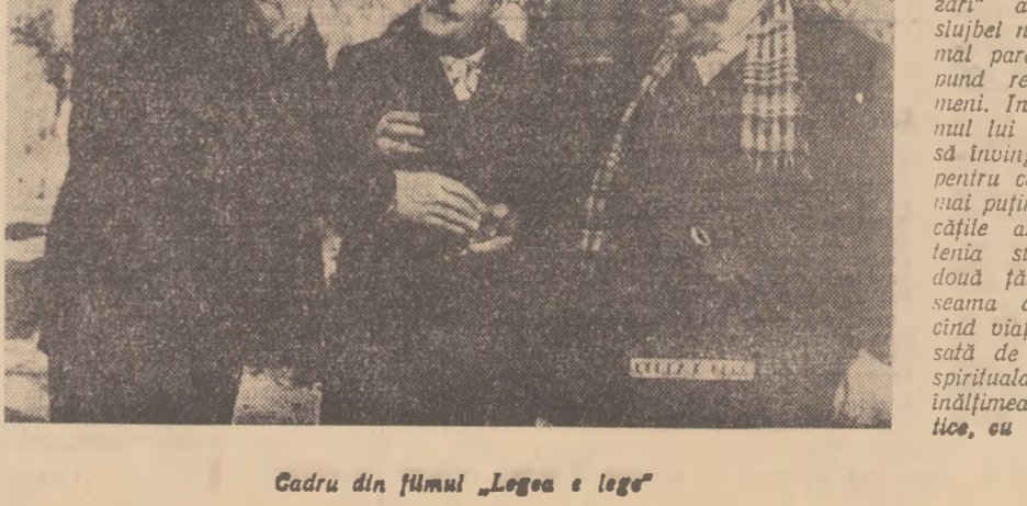
Cadru din filmul „Legea e lege”