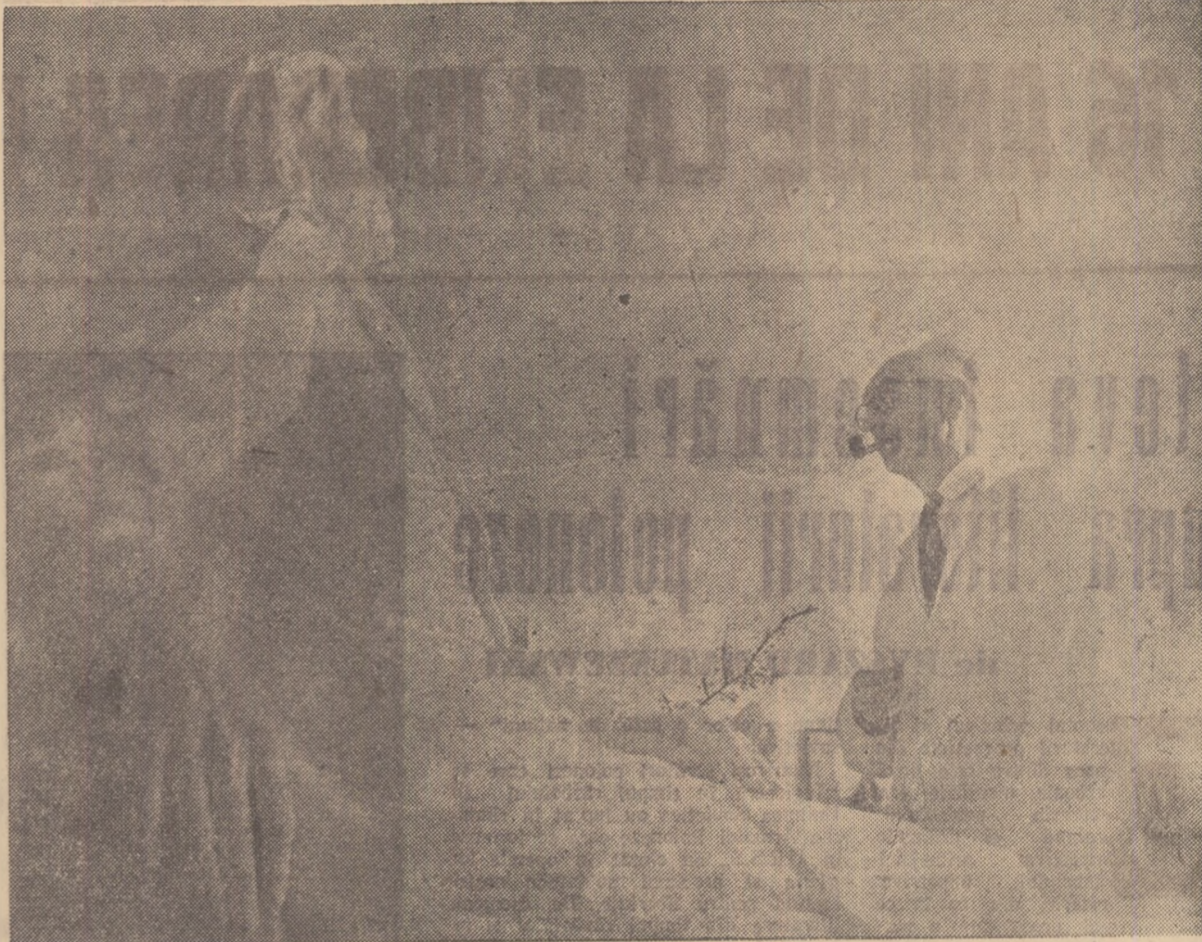
„Ion Jalea - artist al poporului”