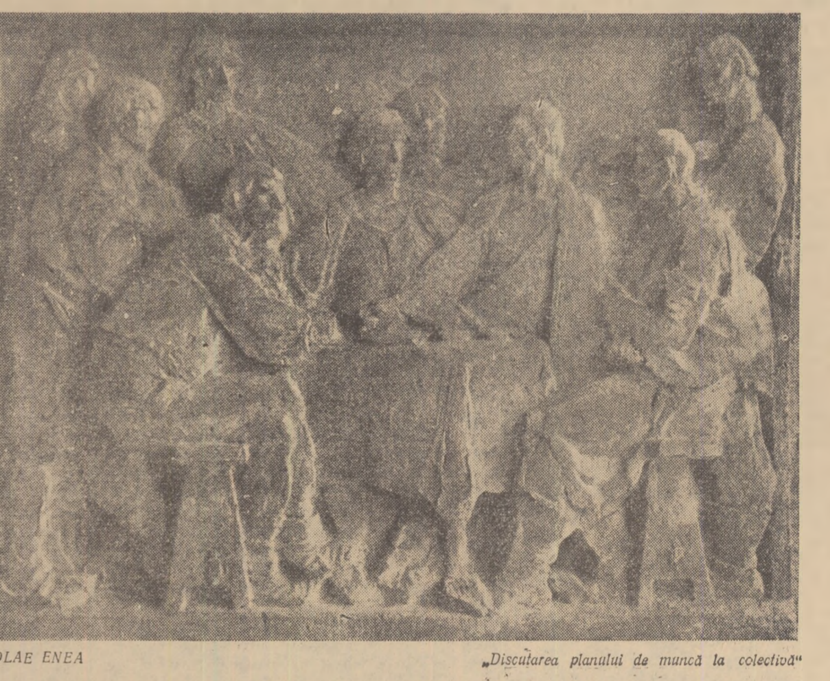
„Discutarea planului de muncă la colectiva”