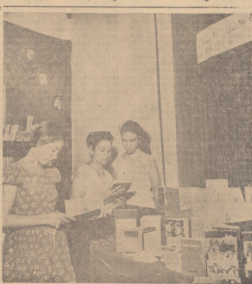
Noutăți la o bibliotecă raională