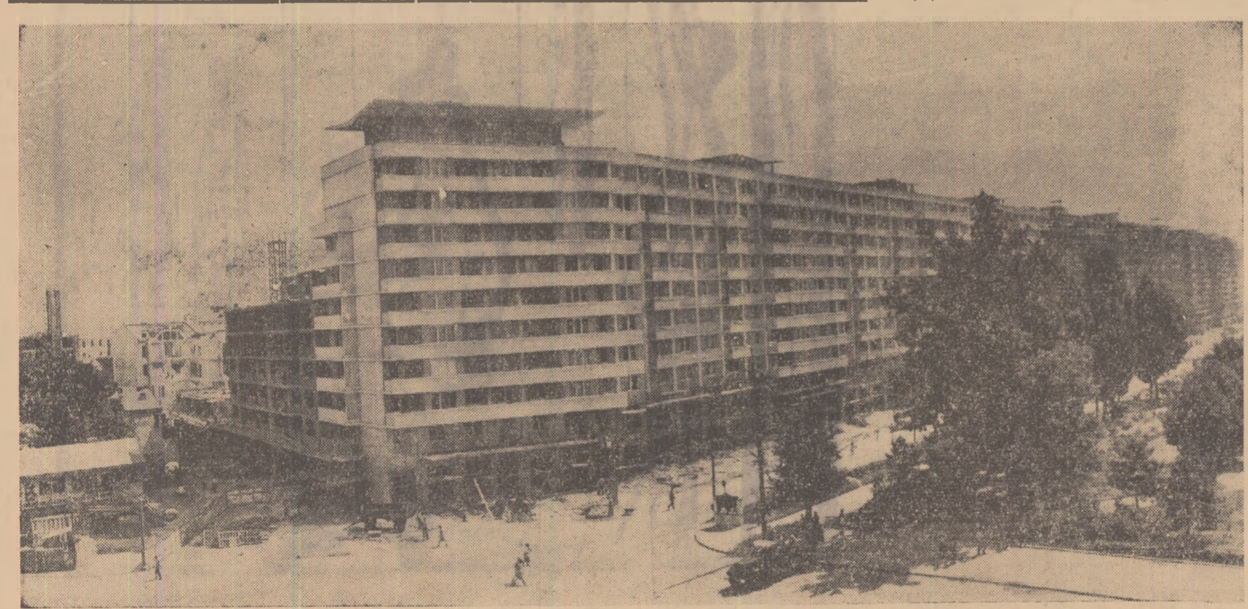
Noile blocuri din piața Gării de Nord

E arhitectura epocii noi, așa cum o dictează tehnica și economia betonului a cîlei și materialelor plastice, așa cum o înlesnesc mijloacele și unimile. Cînd ne-am aflat în pragima vechii gîrî și în umireea care ne-a cuprins nu ne-am stăpînit de a ne abate din drum pentru a-i explora vecinătatea. Știam, firește, că în Gîrița Rosie se construiește mereu, dar cîrele și măchetele și chiar fotografiile arareori impun cîitiorul imaginea vie a realității.