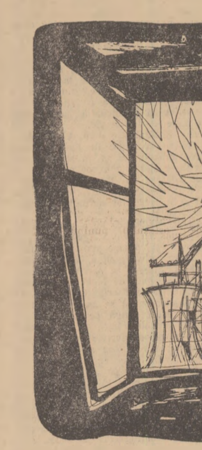
Desen de GRIGORE ONUȚ.

Doctorul Popa Arnold este usăzîv, înalt, cu epărule mari în jurul ochilor și părul presărat cu fire argintii. Halatul alb și cășochea îi dau o expresie puțin severă. Tare și rezistent e nu numai un munte, ci și o lamă de oțel. Privirea fixează așezîți și precis, încrederi.