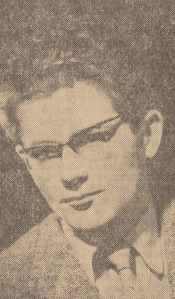
Decamdată acest viitor e doar anticipat de imaginația efervescentă a poetului, care intuiește, în imagini de mare plasticitate, devenirea: „Te-nalți deci. Viteza ne desparte, / Și cu te-ard acum transfigură / În alte epoci, sigetînd departe, / Cu ritmurile care-n coaja lumii bat. / Și în frenetice puls zilnice în timpul / Semne de lucr din evi anterioare. / E vară-n lăunul. Ochiul mi se umple / De lumî în devenire și vilvorî. Există la Cezar Baltag un optimism fundamental (de loc

Ideile majore ale vremii noastre, întîlnind-se toate în idealul Comunei, stimulează neîntreprinsă imaginația poetului. Una din laturile celei mai interesante ale poeziei lui Cezar Baltag o constituie reflecția asupra timpului, nu numai în aspectele lui imediate, dar și în cele de ordin mai general, cu implicații filozofice. Sensul fundamental al timpului (pentru a-l realiza e nevoie să înfrîngi timpul, să-l domini), — e viitorul; „Cît de marî simțem, cît de marî / Timpul nu putea să ne mai încapă, / de aceea l-am spart / și am intrat în viitor”. Viitorul comunist exercită o imensă putere de atracție, și „amagnetă poli”. „Ne smulge viitorul. Lumina lui ne soarbe / Cu buze de jîrlec din lîmce cu pas grozî / dar dacă timpul reprezintă prin înimînța morții individuale, o condiție tragică — „Ninge peste ani neaua vremii multă, / Colbul măcinat al altor veacuri, / Peste vremei căzînd, în culori le-mbracă / Sure-albastre /