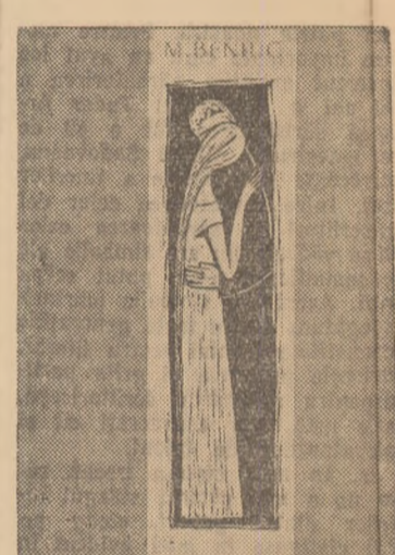
Volumul „Cîntecele inimii de Mihai Beniuc, apărut la Editura Războiului, se află în librării.

Deficiențele de compoziție, însuși clienta selectare și structurare a materialului înfățișat, dau un caracter hibrid eroului. Totuși, talentul de povestitor al lui Tudor Popescu creează episoade reușite în care îngustate copiii se îmbină cu o anecdotică savuroasă comică ori dramatică.