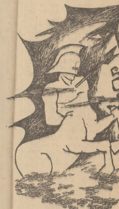
Desene de EUGEN MIHAI

Ca din ocean voi scoate Frumosul tău suspîn Pușin zadarnic poate Și prea tîrziu, pușin.