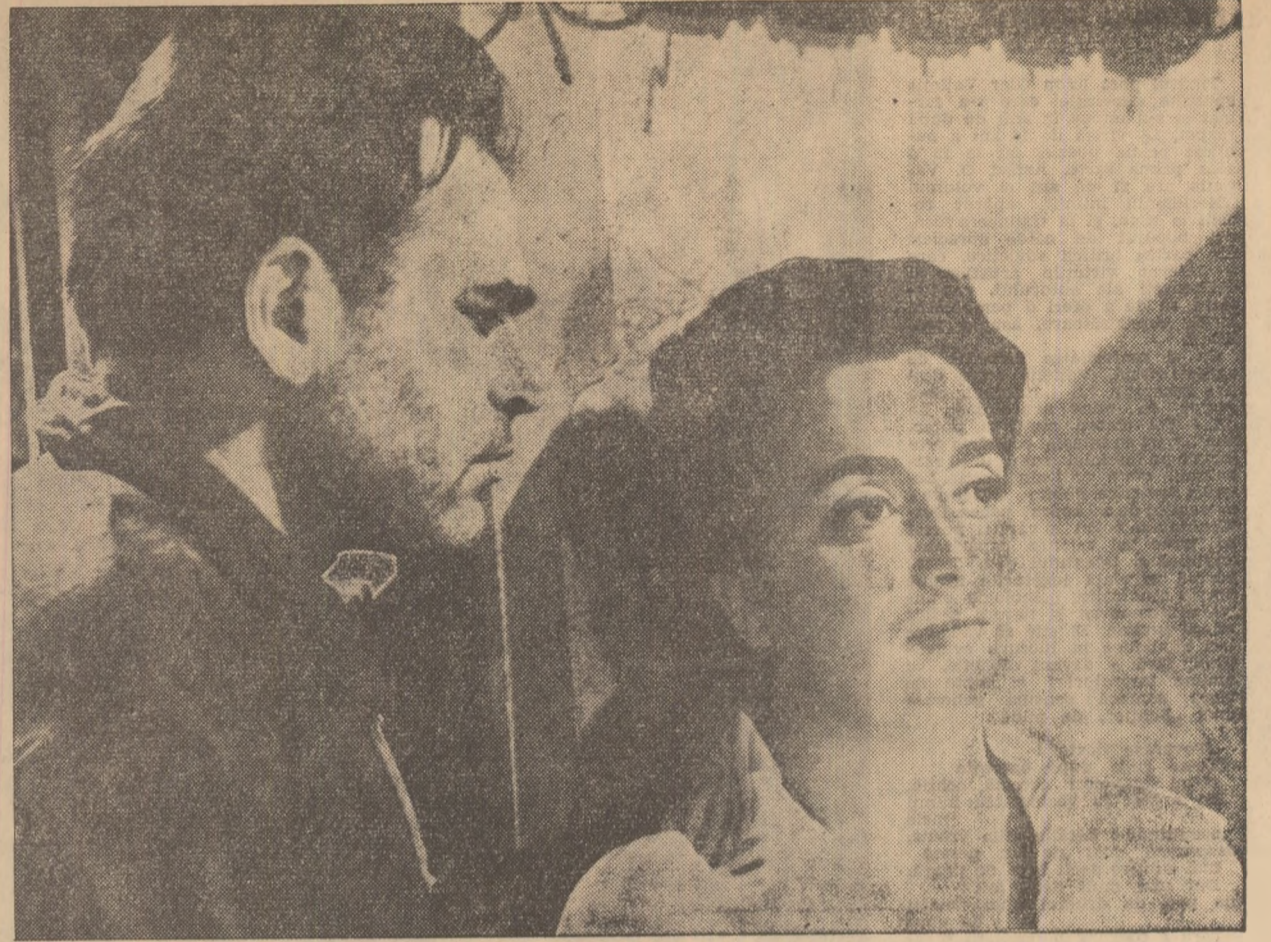
Bodra din film