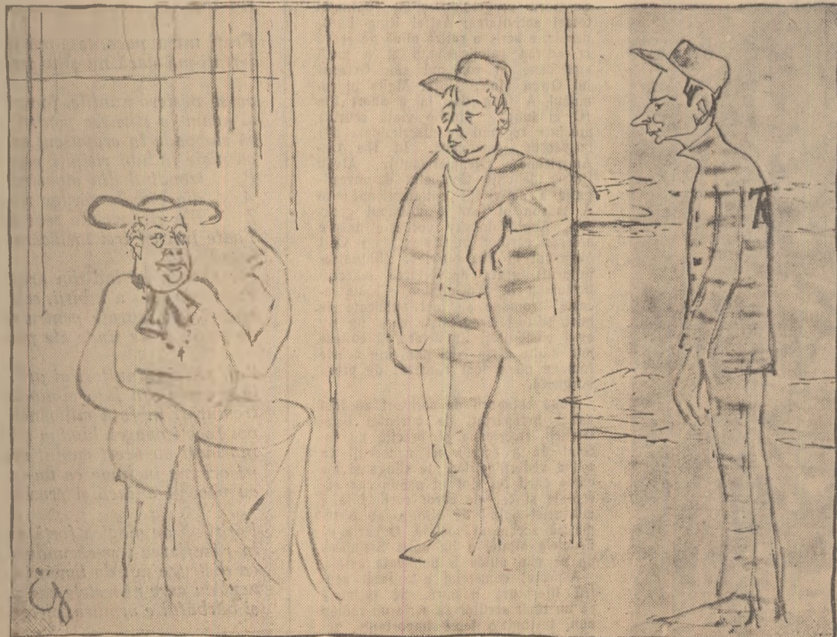
NICOLAE GĂRDESCU (Proetul)