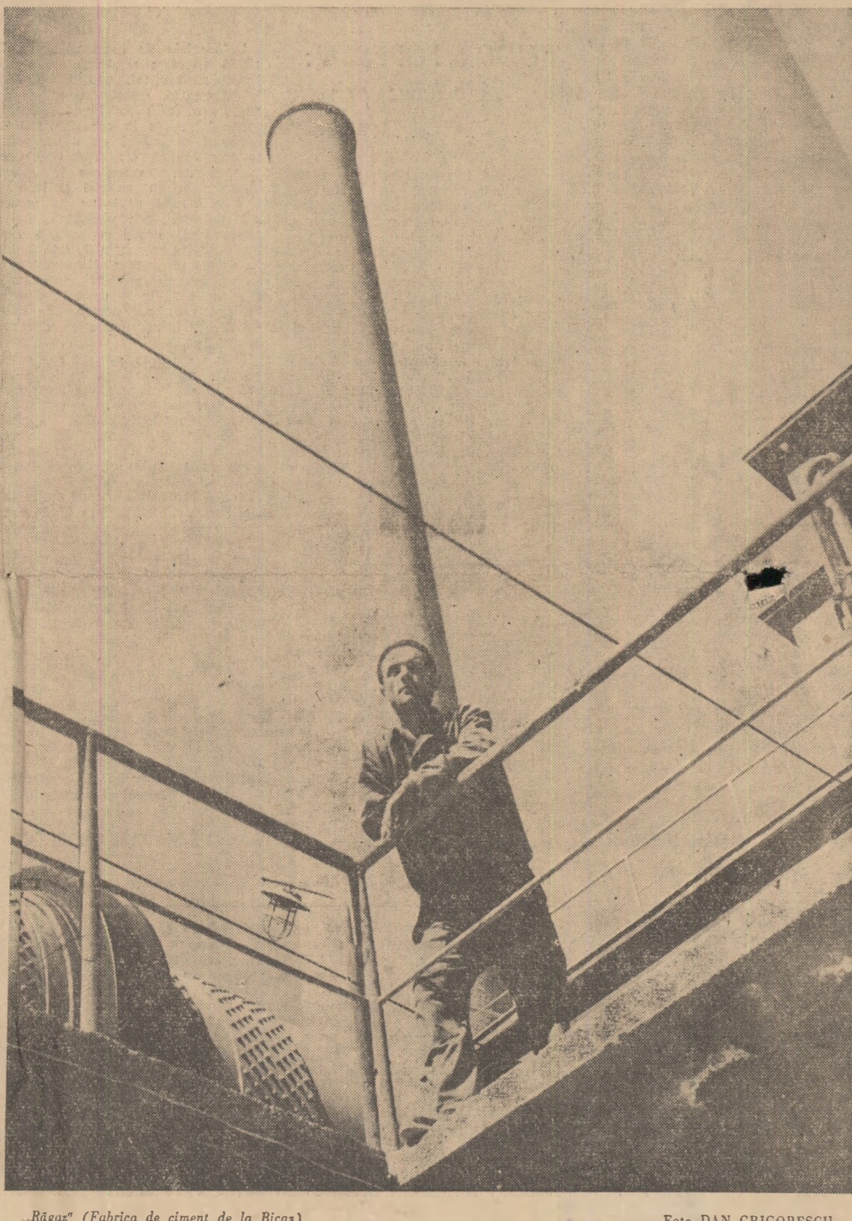
„Răgas” (Fabrica de ciment de la Bicaz)