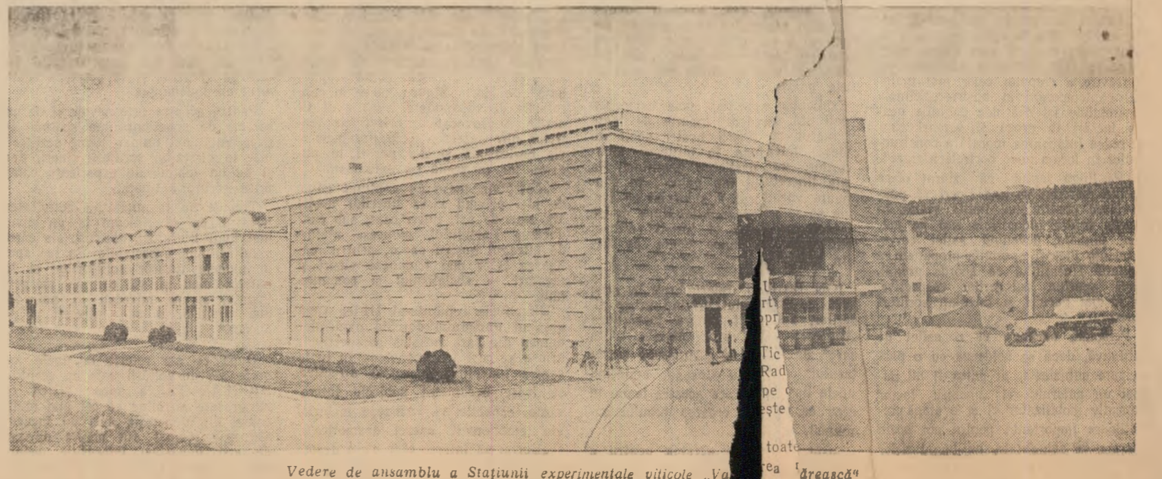
Vedere de ansamblu a Stațiunii experimentale viticole „Valea Călugărească”

Dar el, inginerul, împreună o poezii, se gîndește că ar fi bine a vă comuncie vouă oamenilor de azi și țî-varășii lui buni: cerețaiți cu încet-dere vinurile de „Valea Călugărească”