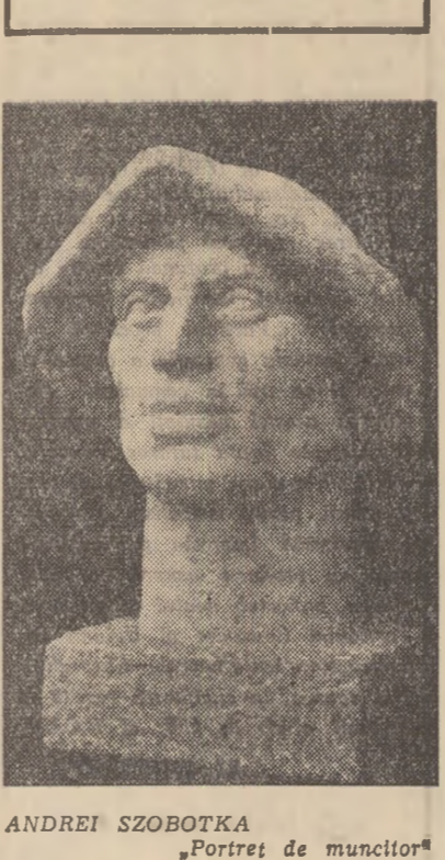
ANDREI SZOBOTKA „Portret de muncitor“