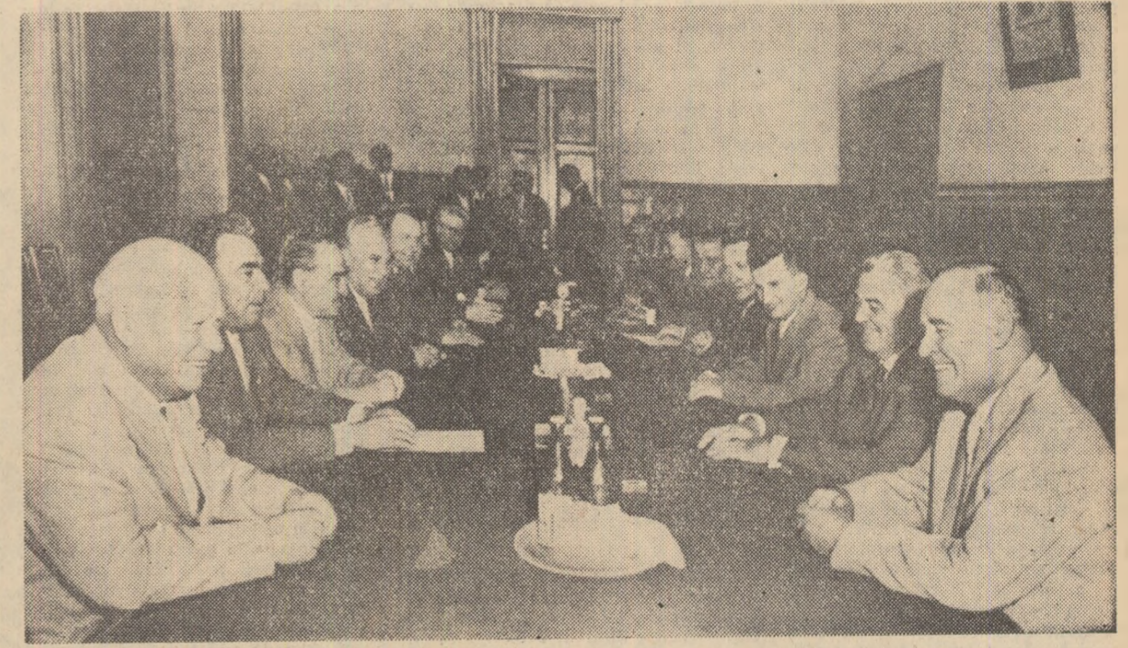
În timpul convorbirilor dintre delegația de partid și guvernamentale a R.P. Romîne și conducătorii ai P.C.U.S. și ai guvernului sovietic.