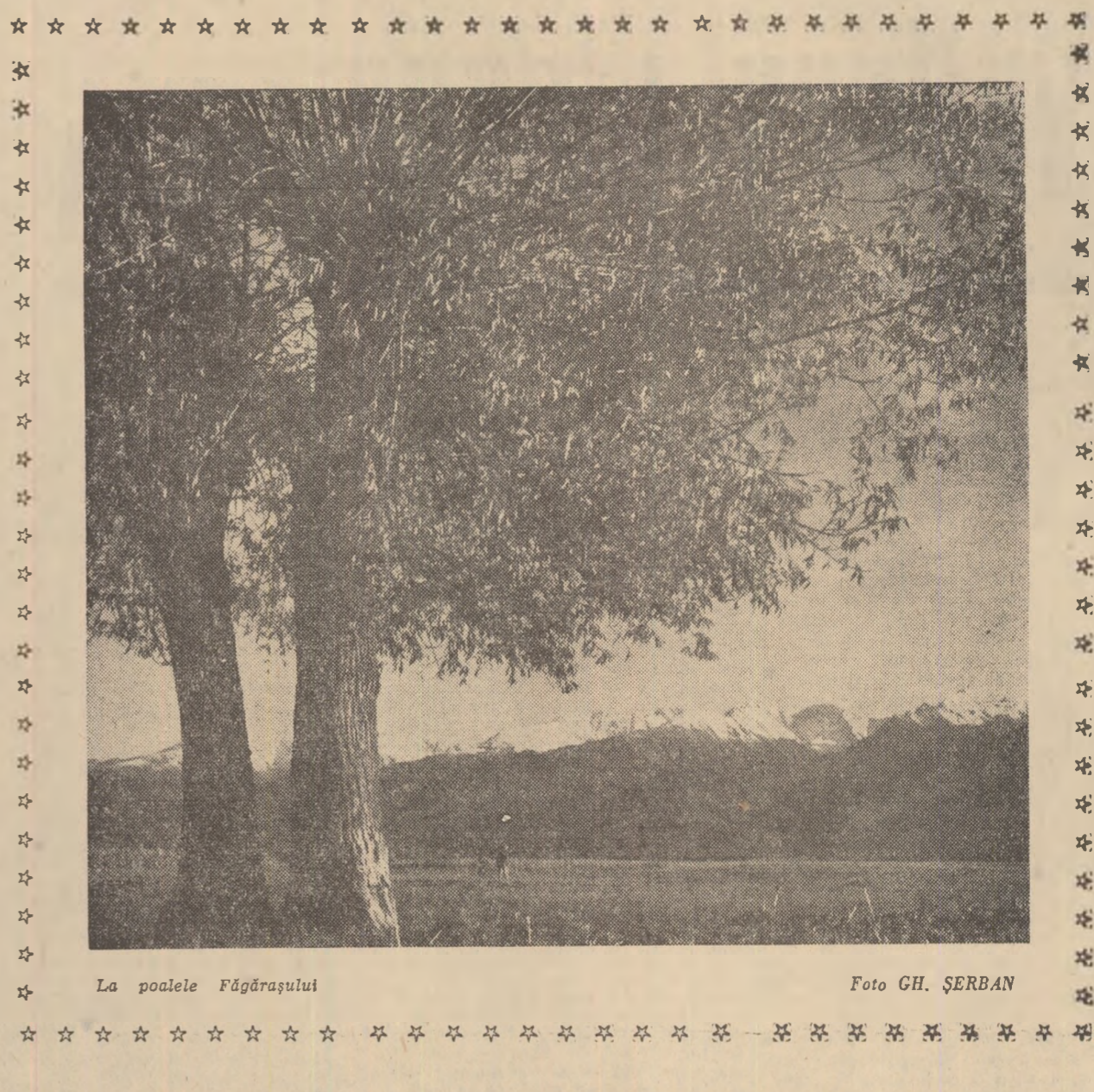
La poalele Făgărașului

Așa cum se spune în Program: „Partidul consideră construirea comunismului în UR.S.S., drept o mare sarcină internaționalistă a poporului sovietic, sarcină care corespunde intereselor întregului sistem mondial socialist, intereselor proletariatului internațional, ale întregii omeniri.