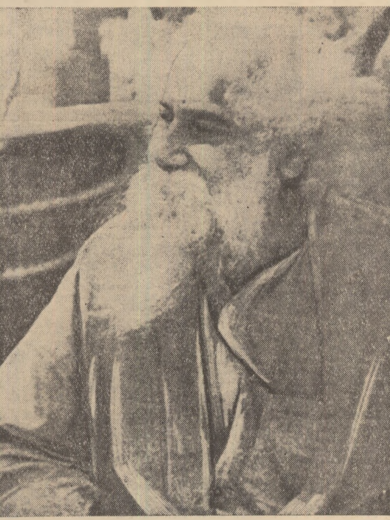
Uriaşul ecou european, inclusiv în ţara noastră, al poeziei lui Tagore...