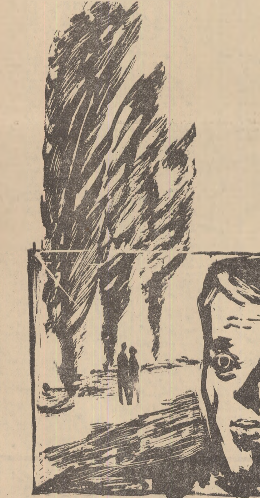
Desen de V. SAVONEA