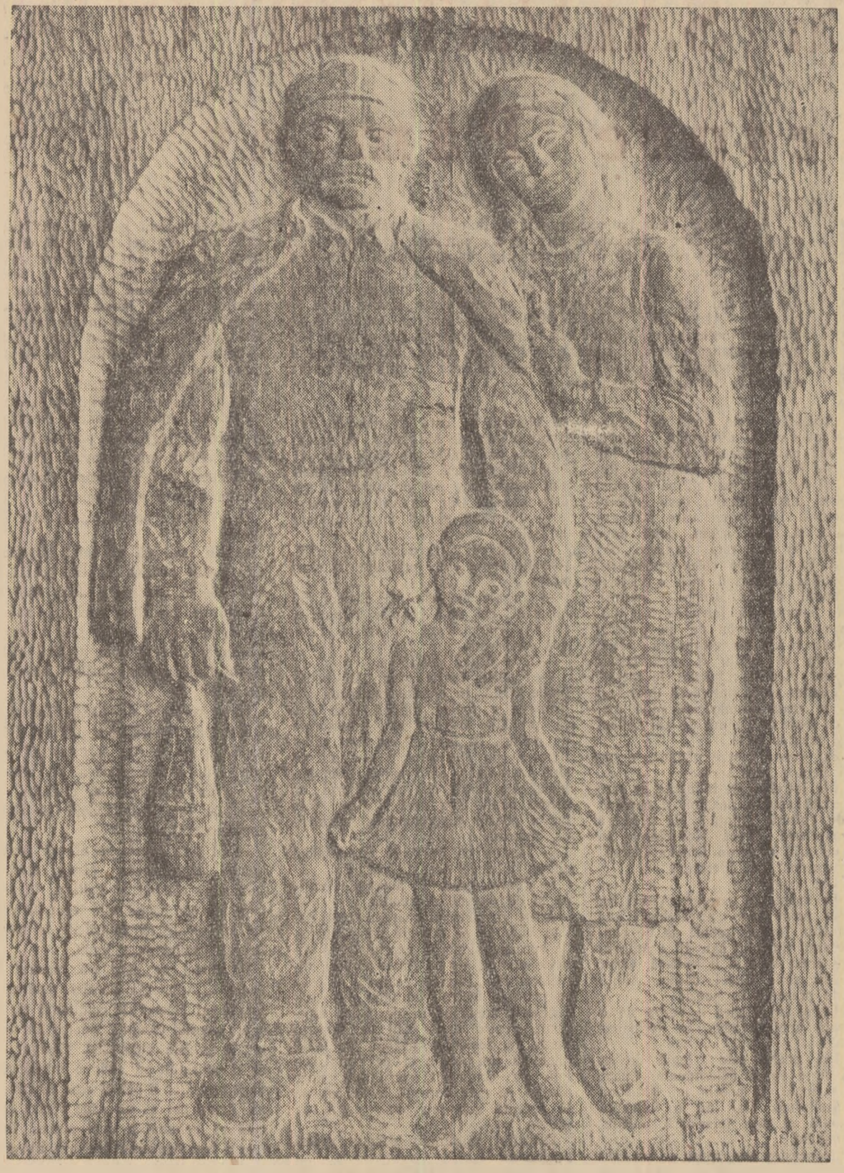
IOSIF FEKETE „Familia minerului”