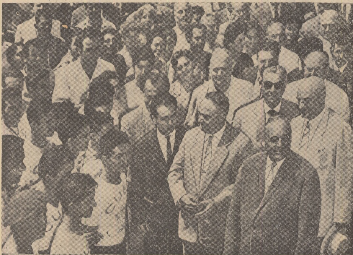
Delegația de partid și guvernamentală a R.P. Romine, printre studenții școlii viticole din Dugomi, R.S.S. Gruzină