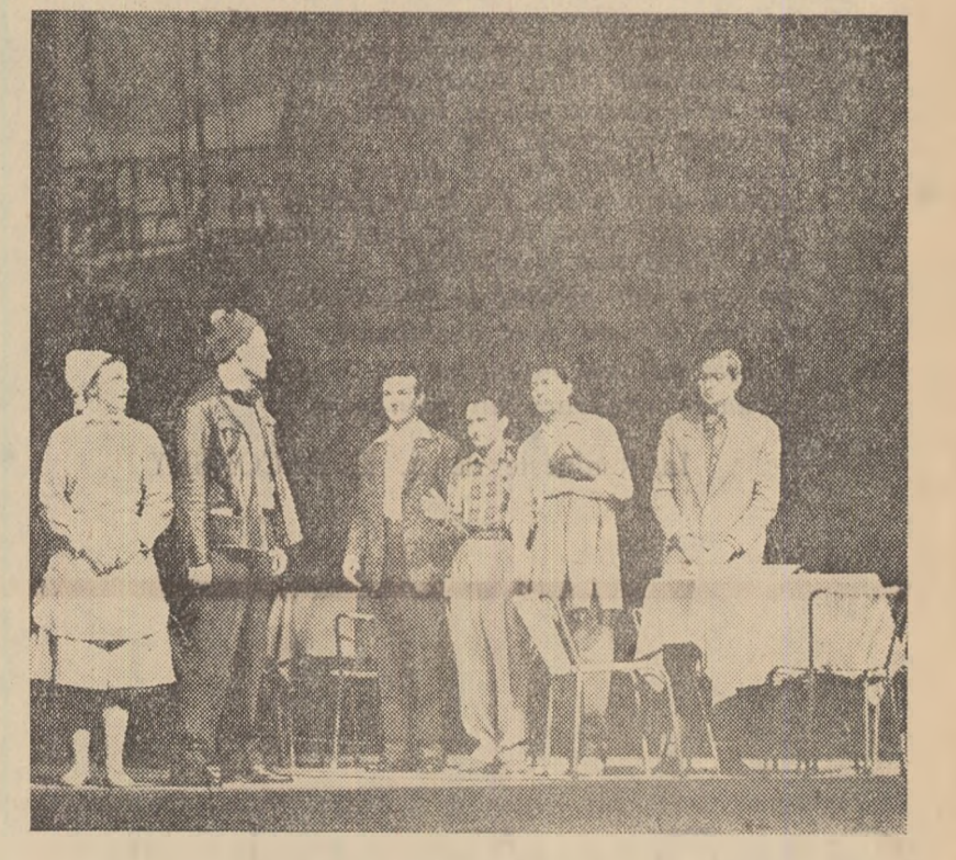
Scenă din spectacolul „Prima întîlnire”, la Teatru pentru tineret și copii.