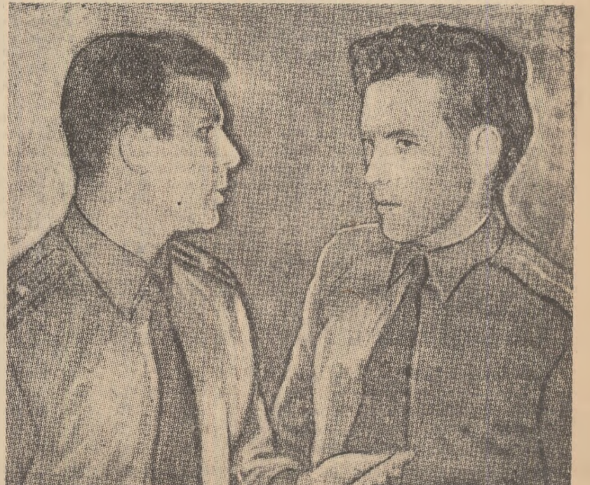
Iuri Gagarin și Gherman Titov