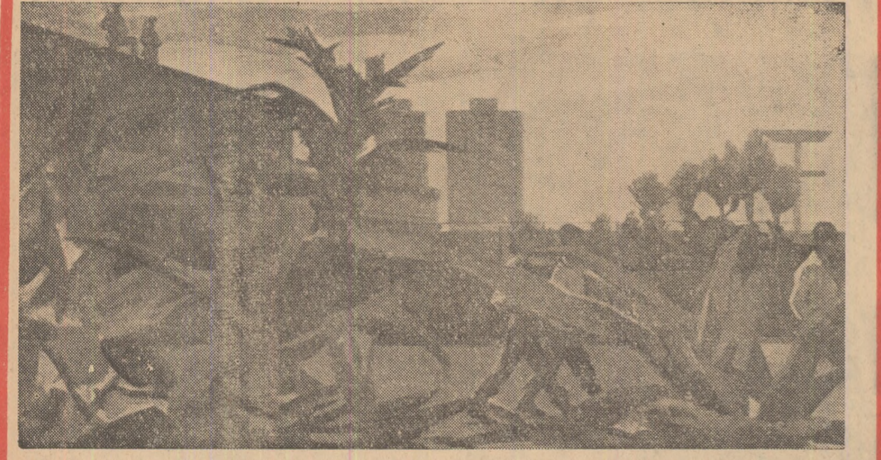
V. IVANOV (U.R.S.S.) "Patria o muer!" (Havana în zilele de luptă)