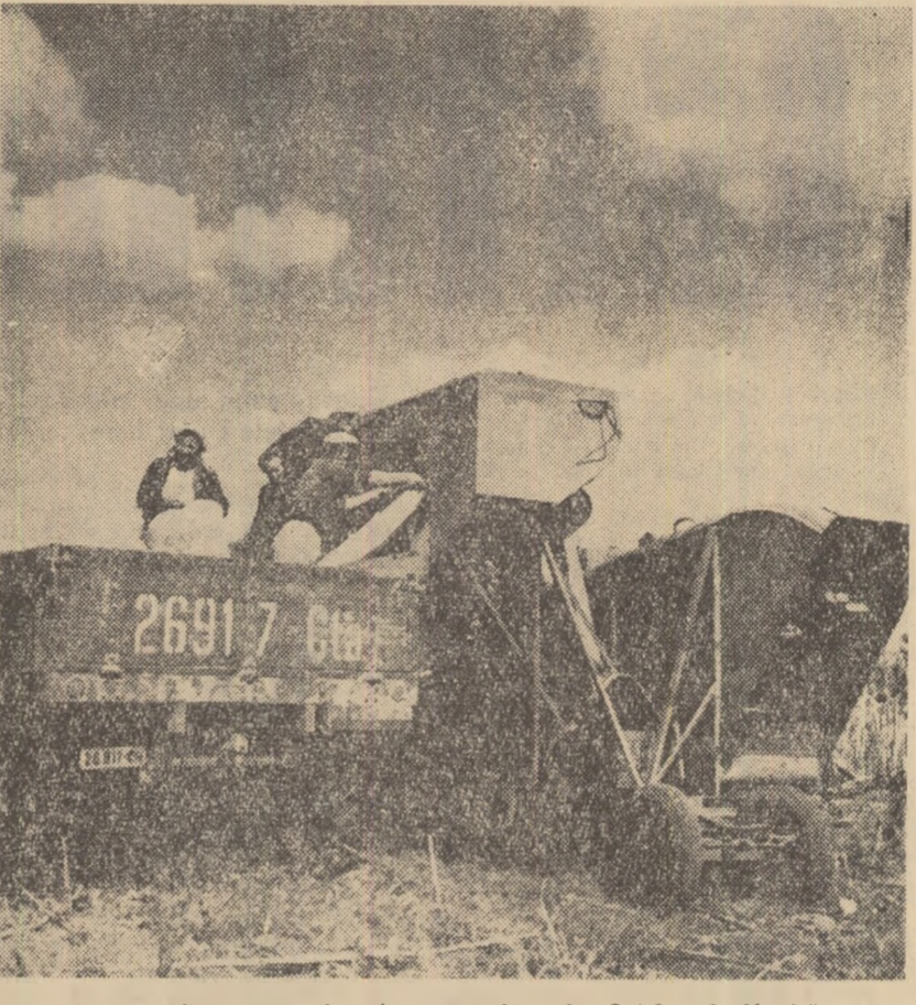
Se descarcă floarea soarelui de pe combină la G.A.C. „2 Martie” (reg. Dobroege).