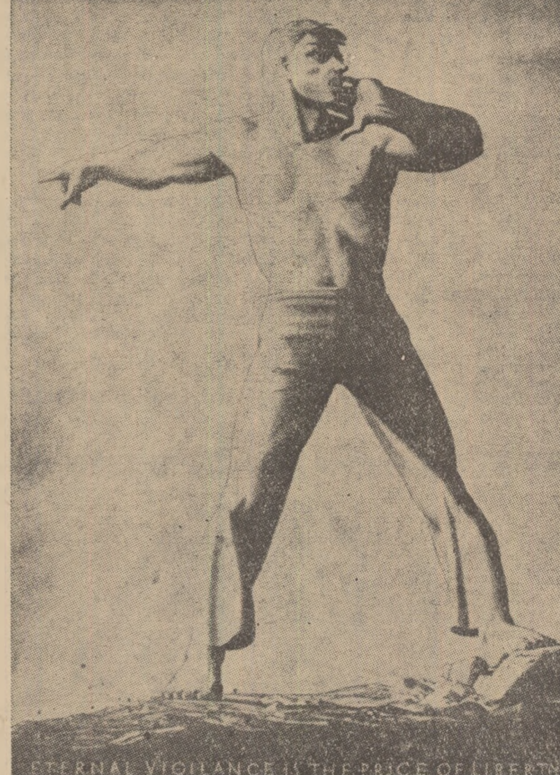
ROCKWELL KENT (S.U.A.) „Vigilență permanentă, garanția libertății”