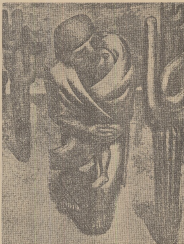
DAVID ALFARO SIQUEIROS 'O mamă jărancă'