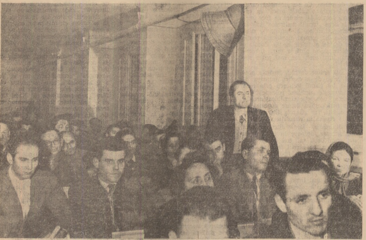
În timpul discuțiilor

pus să se întâlnească mai des cu oamenii muncii din țara noastră, să le afile părerea despre cărțile apărute până în prezent și să discute cu ei despre sarcinile literaturii noastre în anii viitorii. Întâlnirea la care participăm azi se încadrează în aceste acțiuni pregătitoare. Rugăm pe tovarășii din uzină care se află în sală să participe activ la discuții, să-și spună părerea în legătură cu lucrările tovarășilor scriitori care sînt în sală sau ale altor scriitori, în legătură cu presa literară. Vă rugăm să vă spuneți cuvîntul cu privire la problemele de viață pe care ar trebui să le oglindească literatura noastră în viitor.