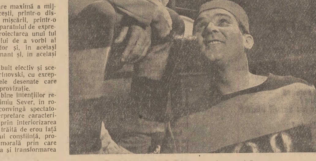
Scenă din spectacolul „Cebrul 702“ la teatrul Rozmaitosci

Lucian PINTILIE: Dacă vrei de-... Lucian PINTILIE: Dacă vrei de-... Lucian PINTILIE: Dacă vrei de-