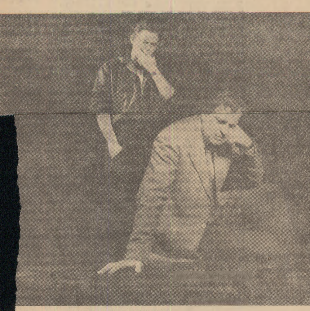
El — „al patrulea“, față în față cu propria conștiință.

Regia a ilustrat o reticabilă a-... Regia a ilustrat o reticabilă a-... Regia a ilustrat o reticabilă a-