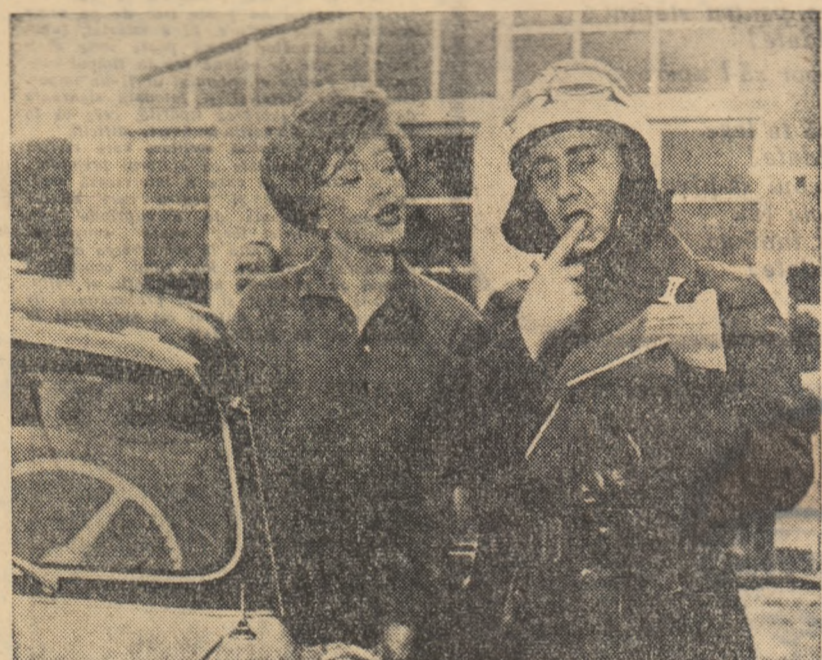
Moment din filmul „Gardianul”