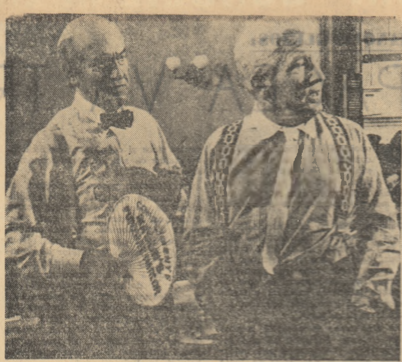
Cadru din filmul „Procesul maimuțelor”