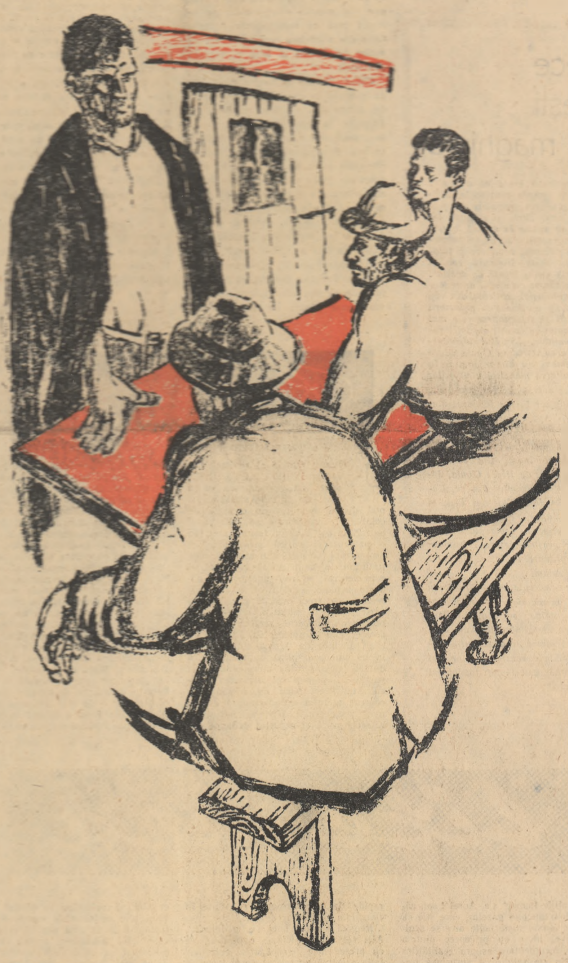
Colectivisti discută Desen de NICA PETRE

Urcat pe înălțimi vedeam adesea, panoramic pământul cu ogoare roștuite în lungi fișii, ca pe-un tablou, pe care un zugrav a tras cu lată pensulă, lungi pete, pogoane de culoare vegetală-n geometrii de plug.