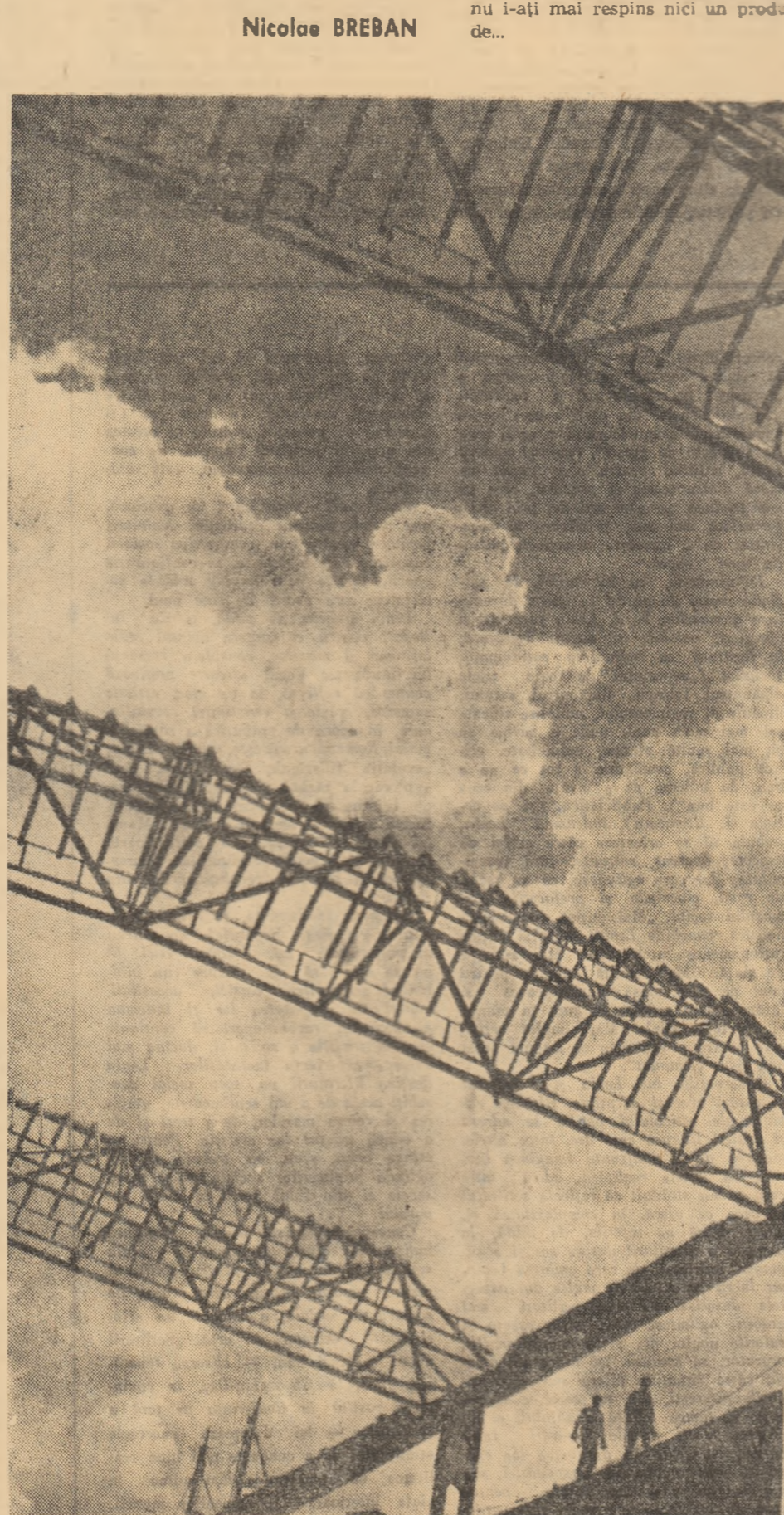
Construcția la Reșița

Fii fericit — și veacul să proamărească slava Desprinderii treptate din vechi încătușări. Urmașilor tăi mîndri le va cînta Brzava Plecare la spre comuniste zări.