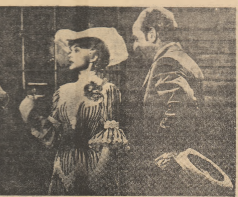
Moment din filmul: „Profesiunea doamnei Warren”

Într-o ocazie a fost prezentată în România o operă de Giuseppe Verdi, „Il Trovatore”, care a sursat foarte mult interesul publicului bucureștean, dovedind o bună școală realistă și o temeinică pregătire artistică.