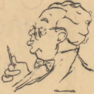
WILY RONEA (Academicianul Grefulescu)