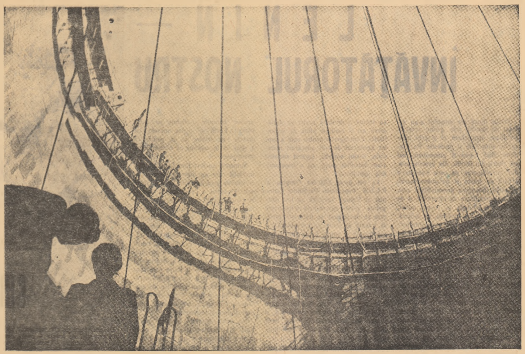
La muntii de carbuni.