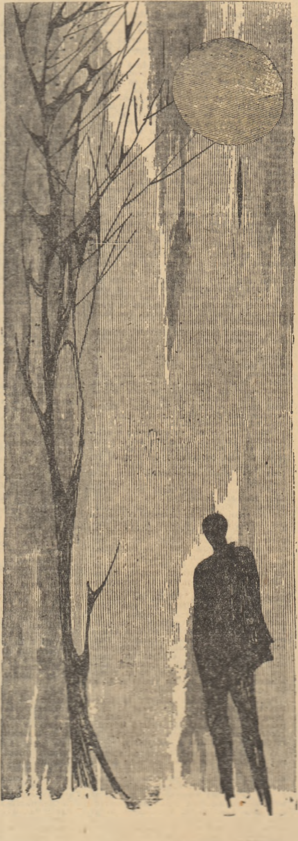
Desen de EUGEN MIHESCU

Nu cred că ar fi război. Nu cred că ar fi război. Nu cred că ar fi război. Nu cred că ar fi război.