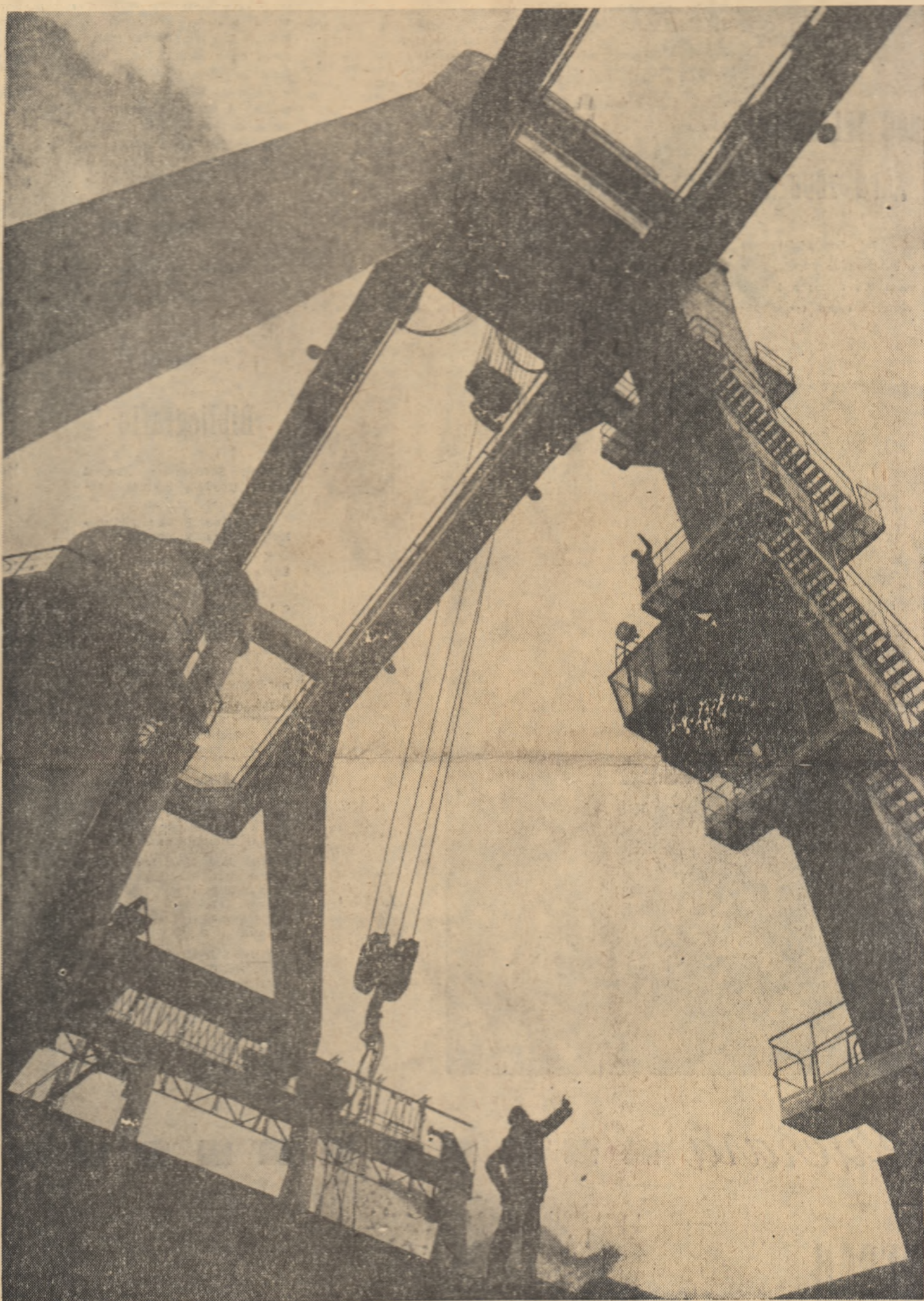
URIAȘA MACARA DIN ROZNOV.