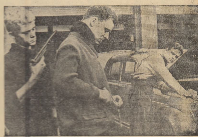
Scenă din film