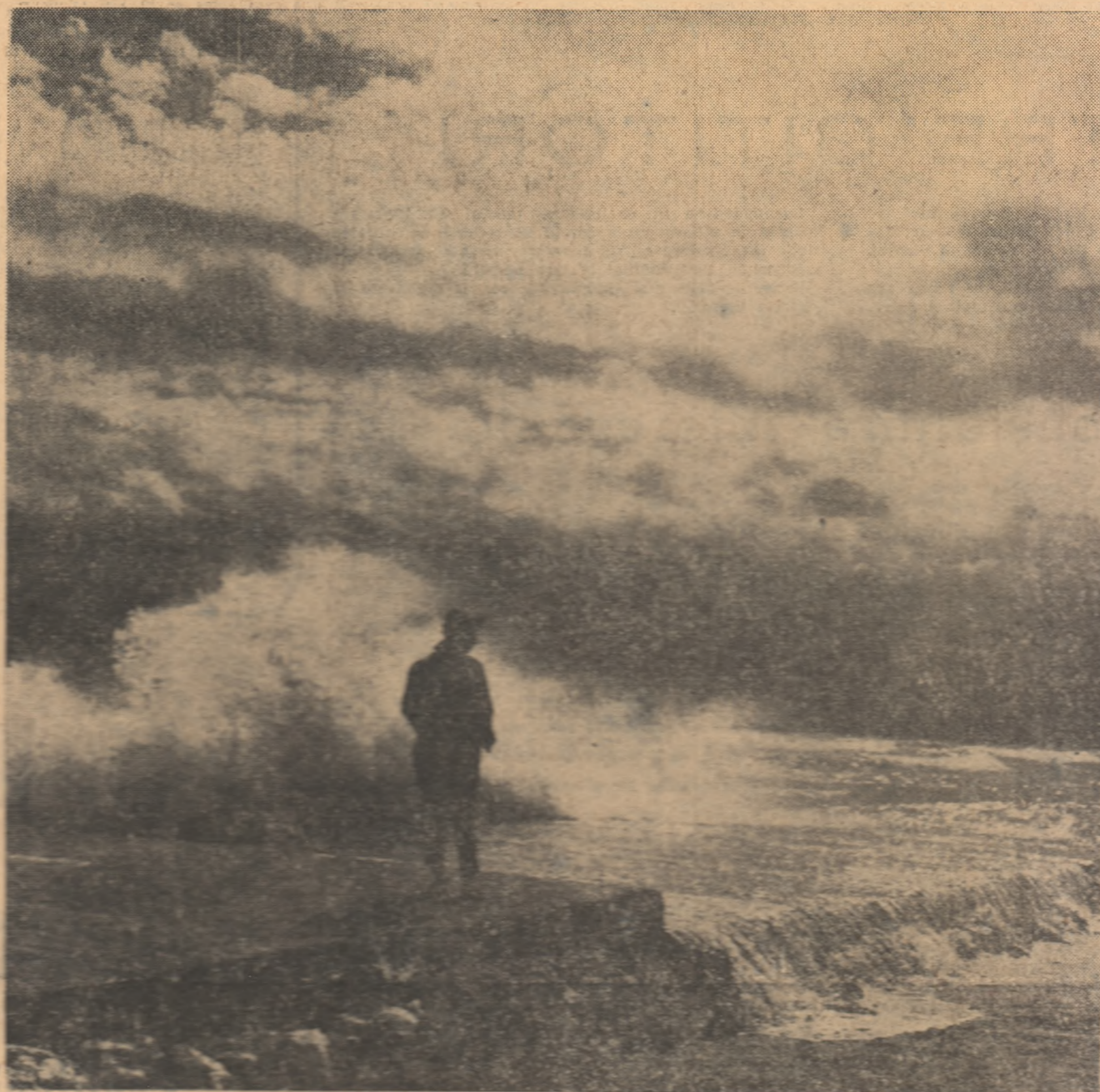
Sfârșit de toamnă la mare