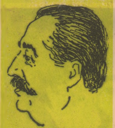
de WILLIAM SAROYAN