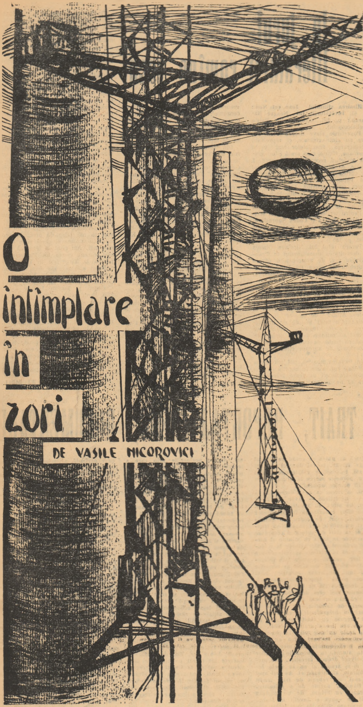
Desen de NICĂ PETRE