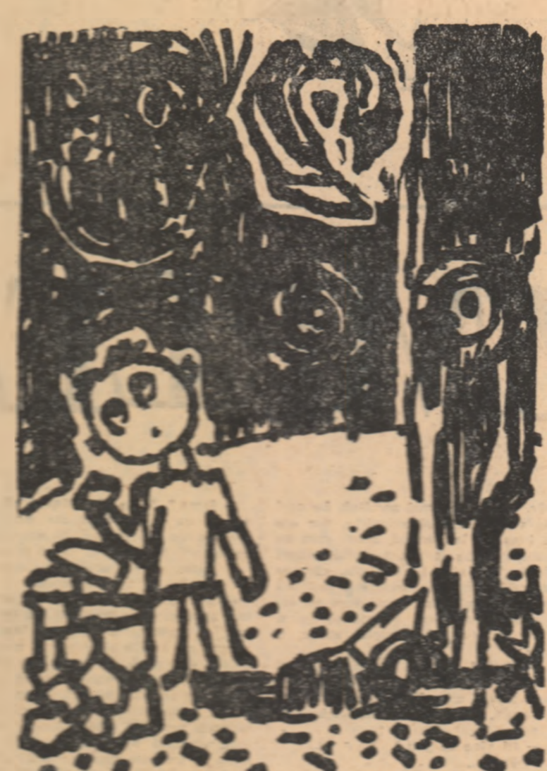
Desene de LIVIU POPA