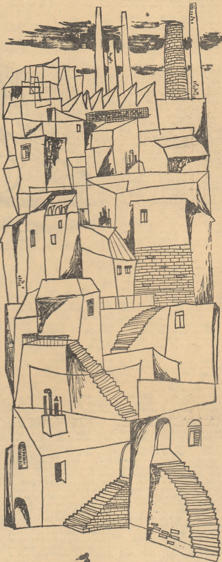
Desen de EUGEN MIHAESCU

Ce caută cerbul? Ce caută adolescența cu stemă de diamant pe fruntea ei îndirjită? Un alt diamant? Mare cit lumea? Să se ciocnească? Să scapere alb, tăios, necrutător? Ce caută, spuneți-mi, rogu-vă, cerbul în aula facultății de drept unde se-nvață legile jafului sanctificat, calculul staticii sociale, consolidarea pilonilor pe care se-nalță masiv, cu reflexe crud roșietice vitelul de aur? Stau în bancă, în sala de cursuri, între un fiu de familie,