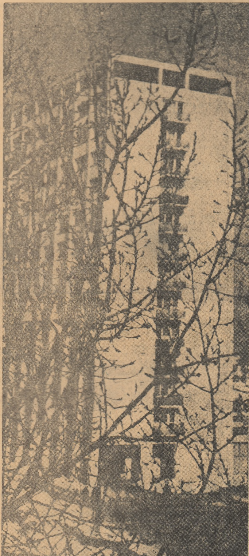
Pe calea Griviței

Unde sosește azi? Intr-o vastă piață de mare oraș, cu o clădire monumentală în față, cu laturi de blocuri imense, elegante stupuri de oameni, cu vaste magazine bogate în mărfuri și cu o revărsare de lumină de neon, în bătaia căreia vîrtejul sau steluța de zăpadă își păstrează grație sau bucurie, fără nimic din spaima amenințării de odinioară că ar putea opri viața în loc. În lumea asta de înalte parapete de locuințe moderne, iarna a încetat de mult de a mai fi o pacoste. Cum intri în oraș? În care oraș? Căci oraș e acum și în dreapta și în stînga. Calea Griviței care se gîtuia aci neagră, scundă, mizeră, astăzi continuă pe o întrecere paralelă, ca în marile orașe, cu însăși liniile