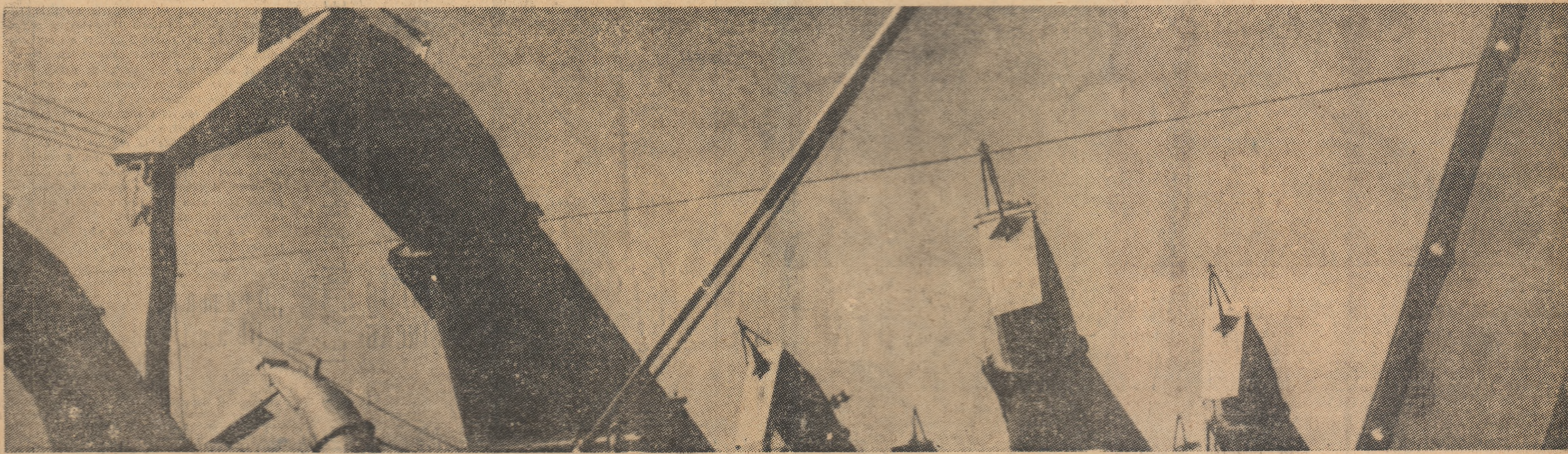
Combinete - cai năzdrăvani