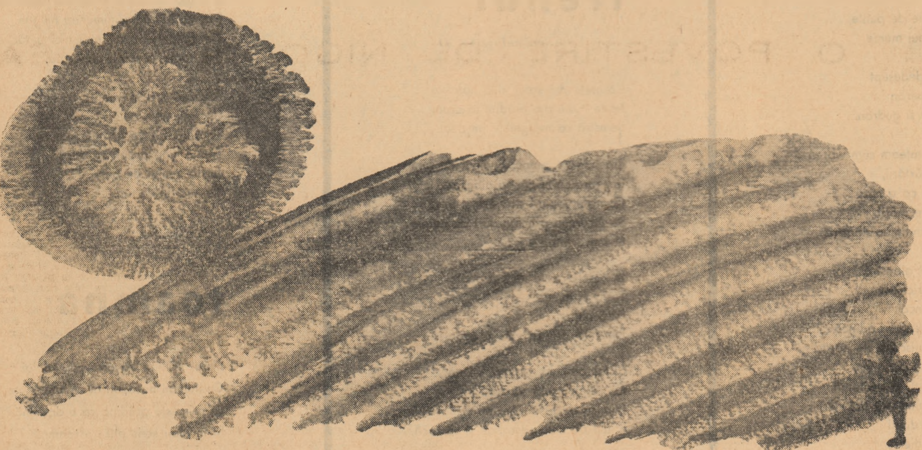
Desen de NICĂ PETRE

- Mi-au făcut ceva - șopti ea repede cu ochii