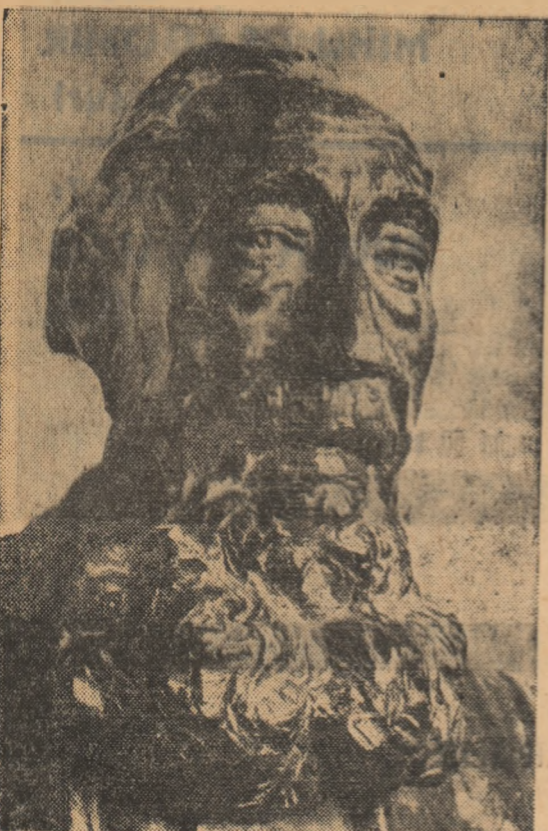
Sculptură de ION IRIMESCU

scriitor popular care a fost Ion Agăribiceanu și astăzi pe membrii familiei, pe prietenii și pe nenumărații săi cititori că-l vom păstra o amintire neștersă.