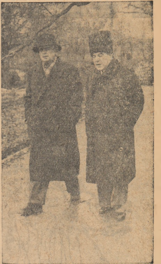
Liviu Rebreanu și Victor Eftimiu.

Liviu Rebreanu nu este un scriitor discutat; el nu stăruiește mai puțin interpretative, controversate ascultate, toată lumea este de acord de la început asupra valorii excepționale a scriitorului său. Critica noastră marxistă a avut o analiză substanțială asupra operei lui Rebreanu, a dezvoltat realismul și fundamentul exemplar, a subliniat puternic realizările de apogeu ale scriitorului și a explicat contradicțiile și esurile. Dar recunoșterea astăzi unanimă a însemnării creației acestuia masive în cuprinsul literaturii române nu epuizează problema, lăsa încă destul loc interpretărilor noi, sublinierii aspectelor încă neinterpretate. Un acord unanim este împotriva aparențelor, departe de a se fi realizat efectul. Faptul confirmă marea vitalitate a operei lui Rebreanu, caracterul ei actual și contemporan.