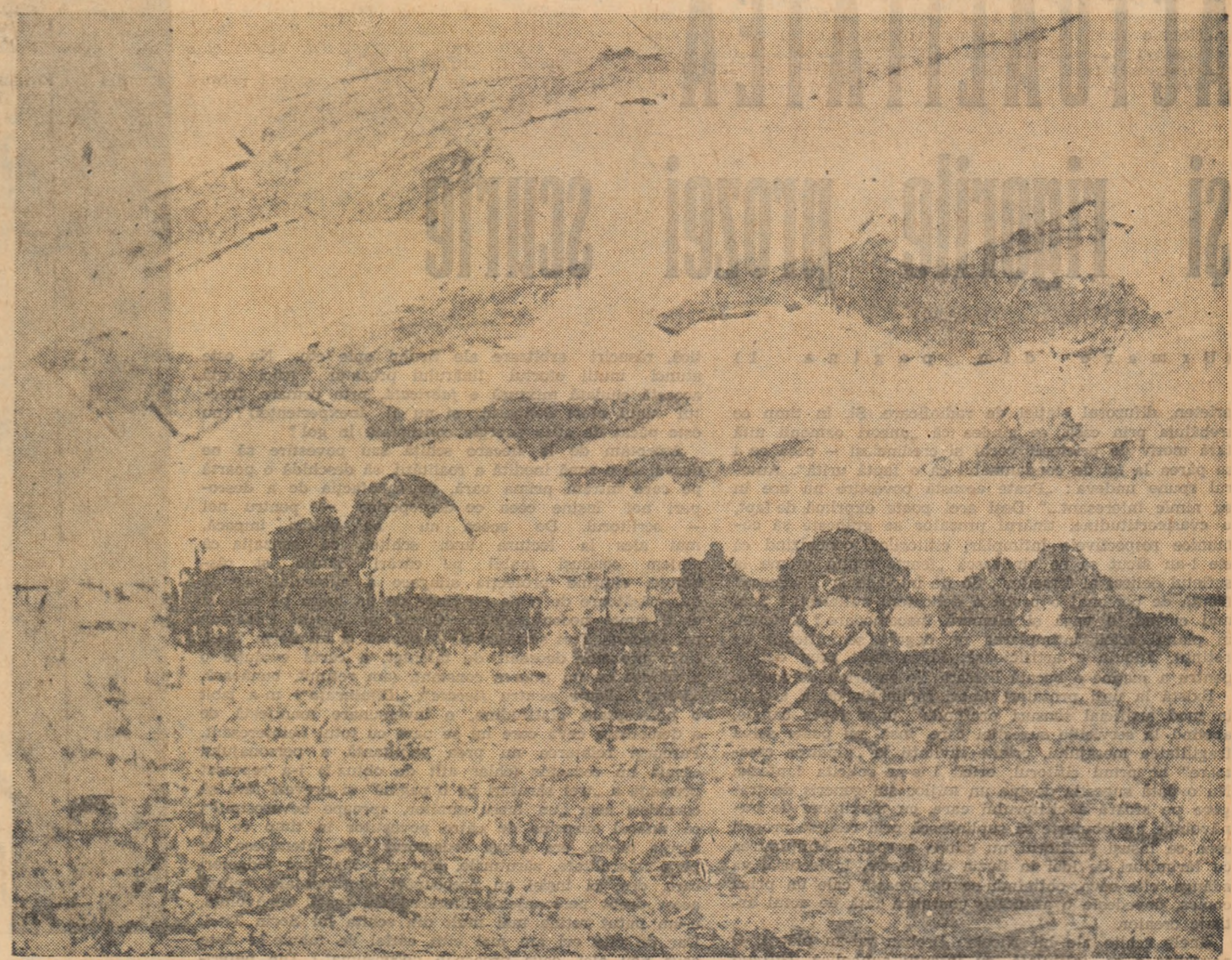
ALIN GHEORGHIU Combina