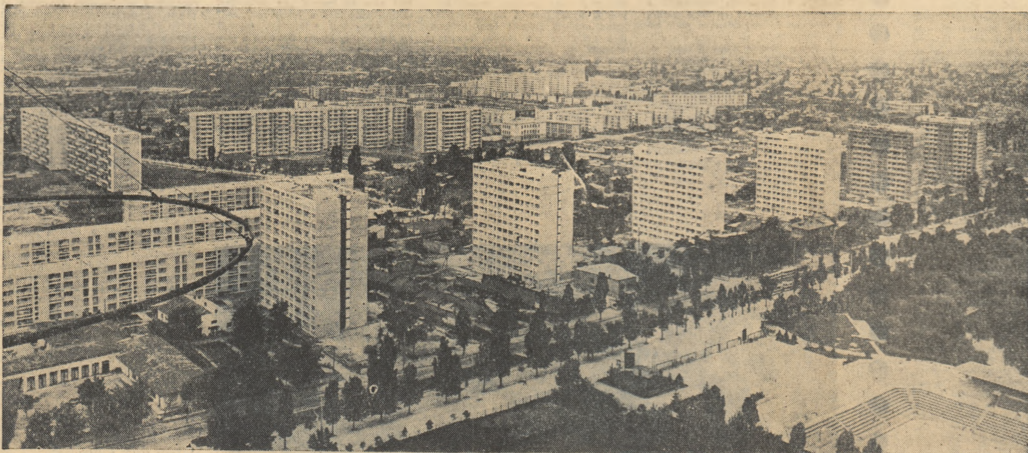
Fotografia: N. DUMITRESCU BUCUREȘTI: „Bolta Albă”