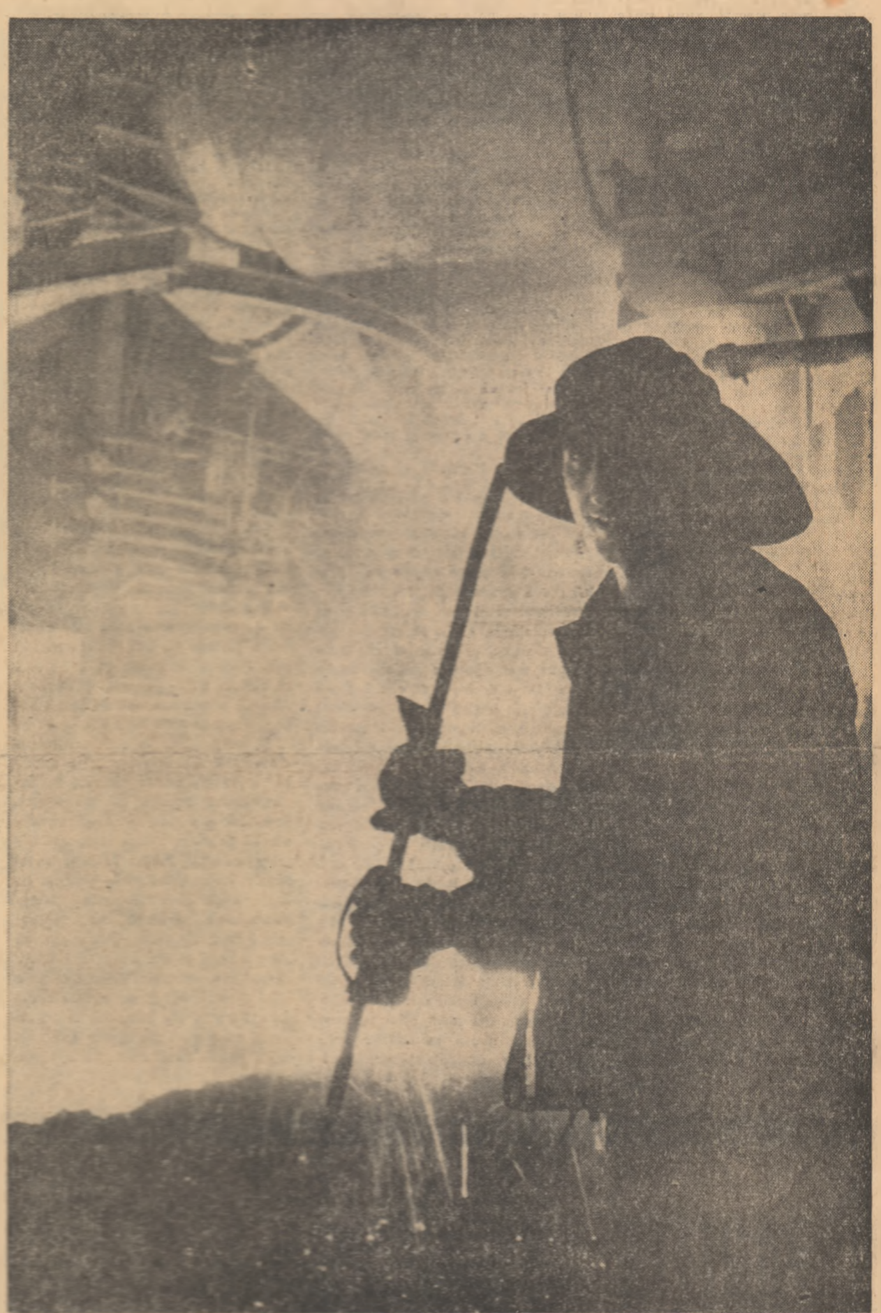
Bucuria creației

Vînd să lăsăm cititorului toate delicile lecturii, n-am transcris aici din înditul cifrelor cuprinse în cele 600 de pagini ale tomului, care-și prefigurează acum, de Anul Nou, frumusețile anilor ce vin.