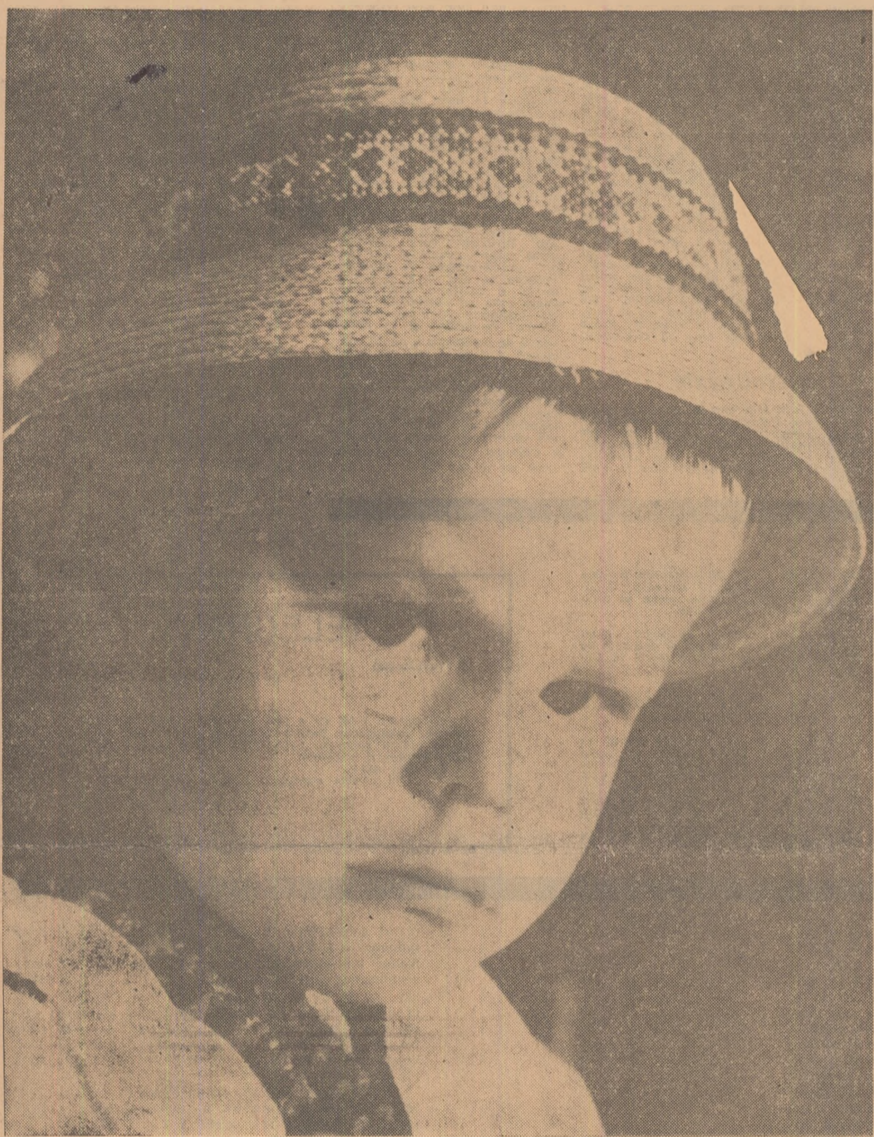
Copil din Oaș