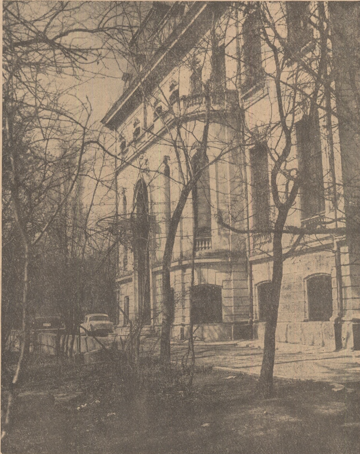
CLĂDIREA UNIUNII SCRITORILOR