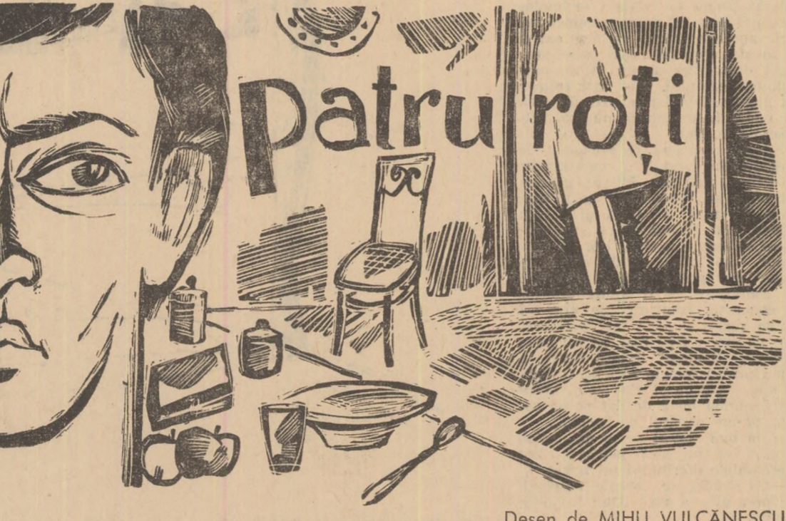
Desen de MIHU VULCANESCU

— Înțeleg, spuse Bănică, înțeleg așa, că nu mai corespund. Poate că n-am corespuns niciodată... poate că numai întimplarea te-a adus aici, într-o seară, și te-a lăsat aici, pînă la noi ordine... — Îi fi vrînd să spui că n-am ținut la tine? — Se gîncea în glasul ei o veche și aprigă dorință de scandal, înăbușită pînă acum, de la o zi la alta, de glumele și de asigurările lui (împrovizate, fanteziste) că ei doi „o să dea lovitură”, dacă nu altfel, măcar la Loto-pronost. El nu se gîndea la nici o lovitură, el își vedea de lucru ca oricare, de citeva distracție, de cite-o de mașini, învîta regulamentul de circulație, și cite economiile se adunau greu pe un Cee cu dobină din care pricea încă nu se închipuise la volan, cu nevasta alături, el conducînd, degajat, ea povestind despre alții, care au o mașină mai proastă decît a lor... Știa că peste cîțiva ani, poate chiar mai repede decît se așteaptă, o să aibă și-o mașină — dar pentru Stela cîțiva