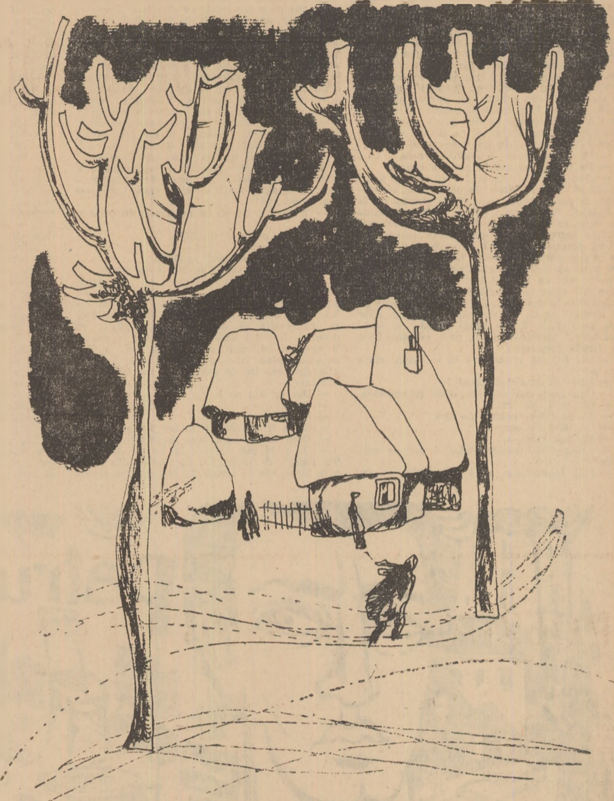
Desen de EUGEN MIHAESCU