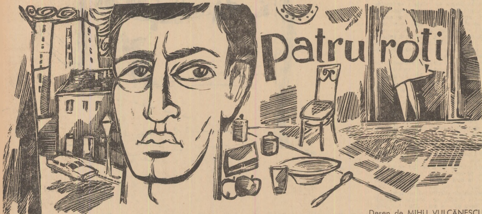
Desen de MIHU VULCANESCU

place s-o iei răzna. Parcă ai fi de capul tău, te-leu. Parcă ai fi din ăia cu „ce-am avut și ce-am pierdut”! Oare de ce nu-ți intră tîe în cap, odată și bine, că ești bărbat cu nevastă, iar nevasta vrea să fie și ea în rînd cu altele neveste!