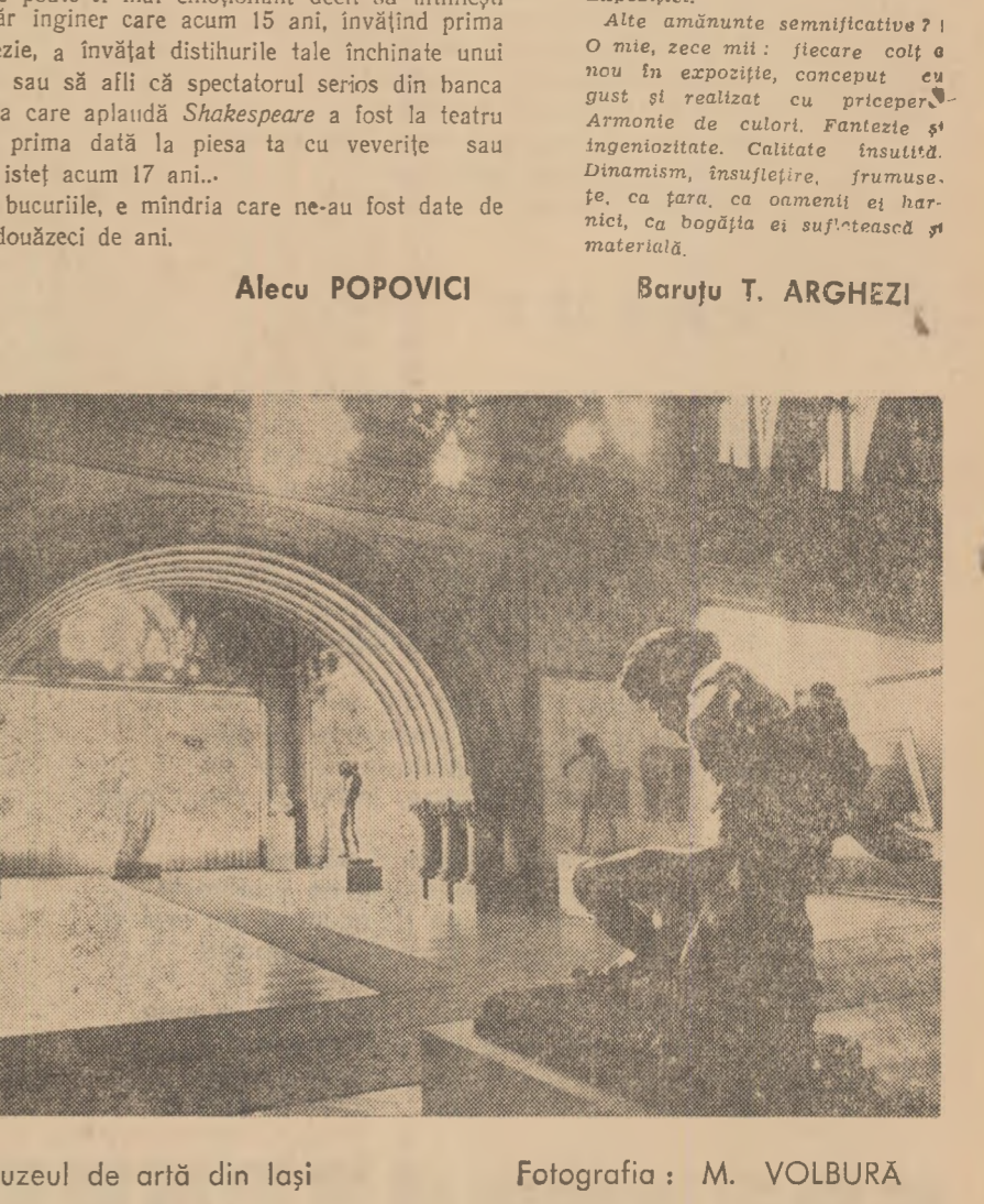
Muzeul de artă din Iași

Expoziția realizărilor economiei naționale a R.P.R. reprezintă nu numai o expresie cantitativă și calitativă a variatorilor produse rômânesti, prezente în sutele de standuri în formele lor superlati-ve. Curiozitatea și sensibilitatea vi-zitatorilor este răspîlîtă și pe planul sentimentului al finelor sub-țintăți.