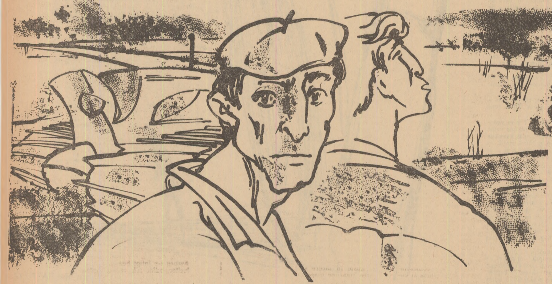
Desen de MIRCEA DUMITRESCU