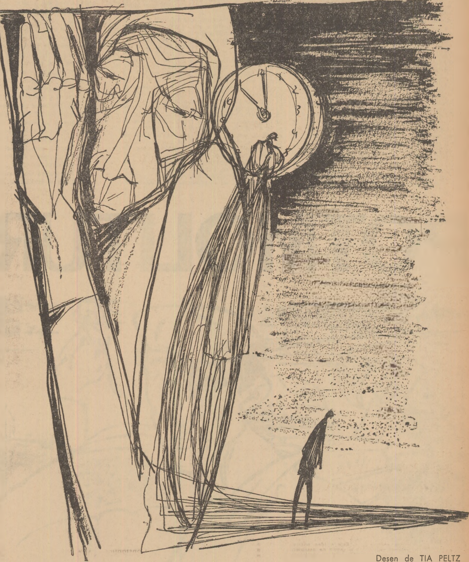
Desen de TIA PELTZ