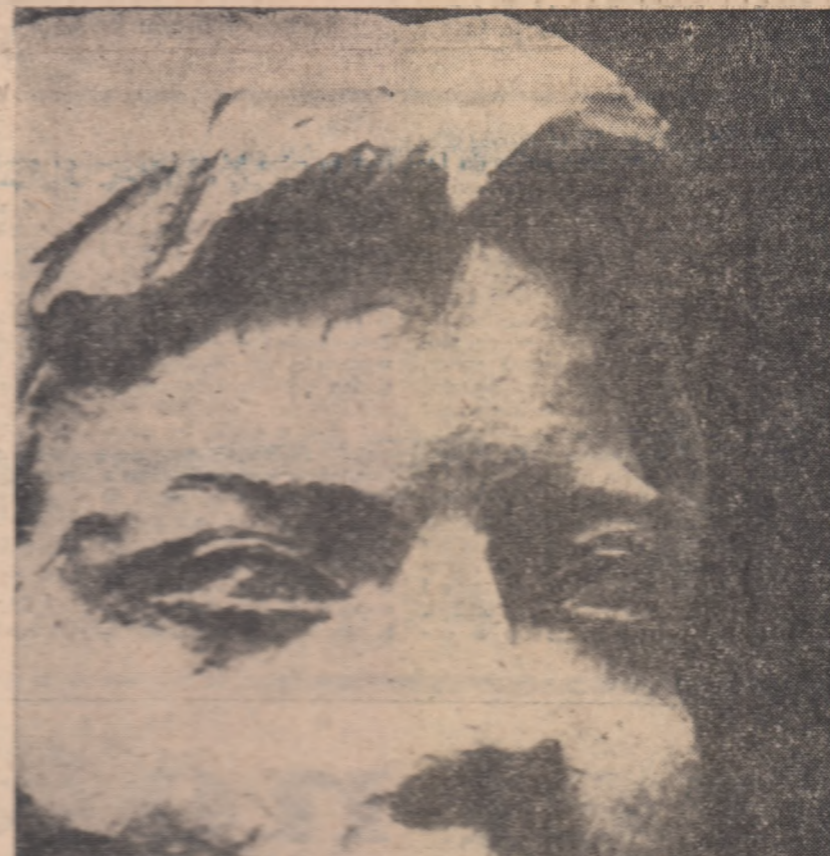
ION JALEA Muncitoresc (detaliu)