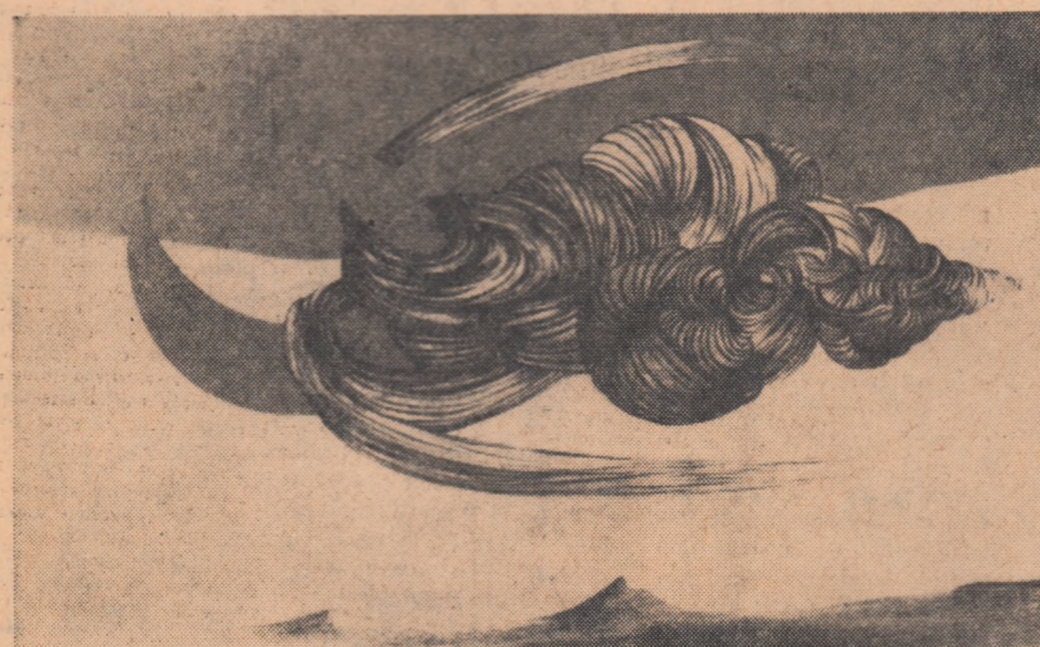
FELIX LABISSE (Franța)

Oamenii de știință, cultură și artă, scriitorii români, și-au exprimat și își exprimă speranța că mesajul profund umanist cuprins în Declarațiile de la București va avea răsunet în conștiințele confrăților lor de peste hotare, va polariza pe viitorii de bine și pace din lumea întreagă. Pentru că singurul gînd care ne animă pe toți este să o facem din această eră a zborurilor cosmice o eră de dreptăți și bunei înțelegeri între popoare.