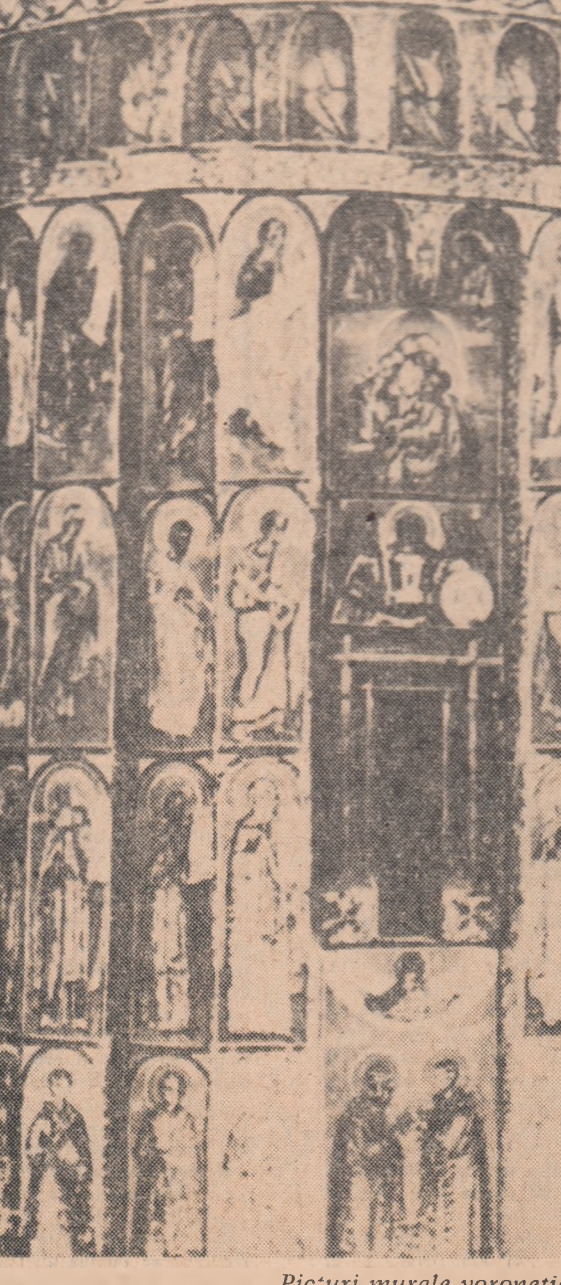
Picuri murale voroneștine