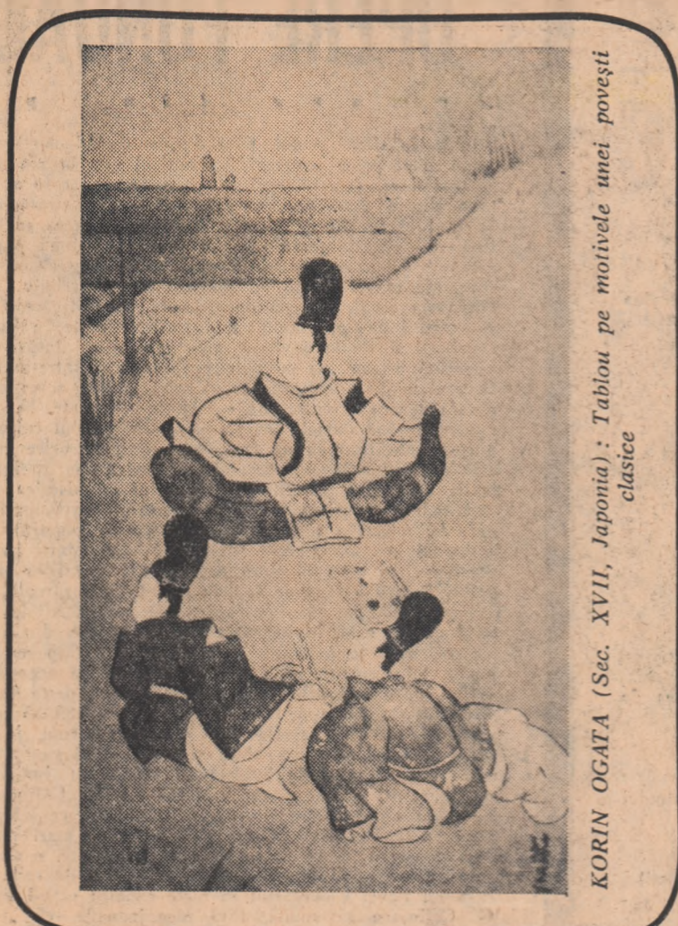
KORIN OGATA (Sec. XVII, Japonia): Tablou pe motivele unei povești clasice

Imprinat la Întreprinderea poligrafică „Informația”