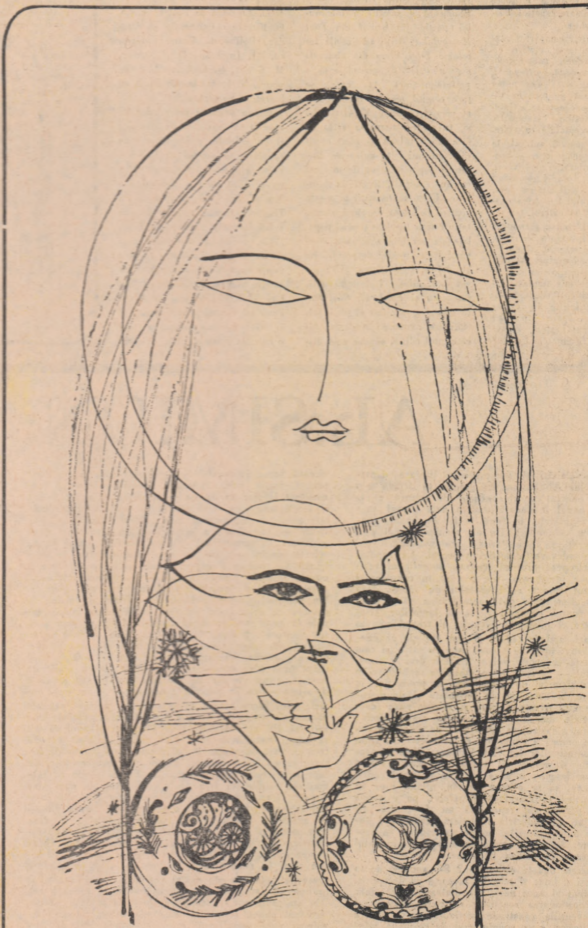
Desen de MIHU VULCANESCU