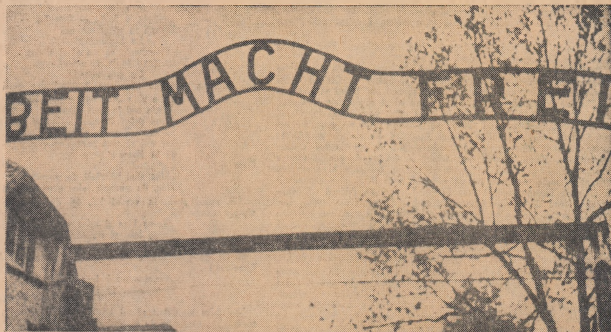
Inscripție la intrarea într-un lagăr nazist: „Prin muncă spre eliberare”