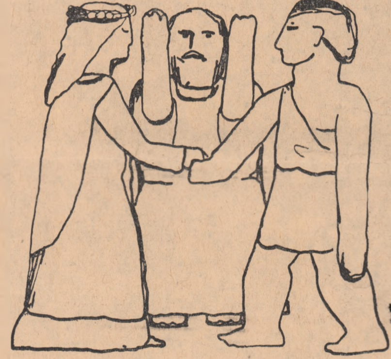
Patriarhii îi legau pe oameni cu căduse eterne. Desene de RENE PORTOCARRERO (Cuba)