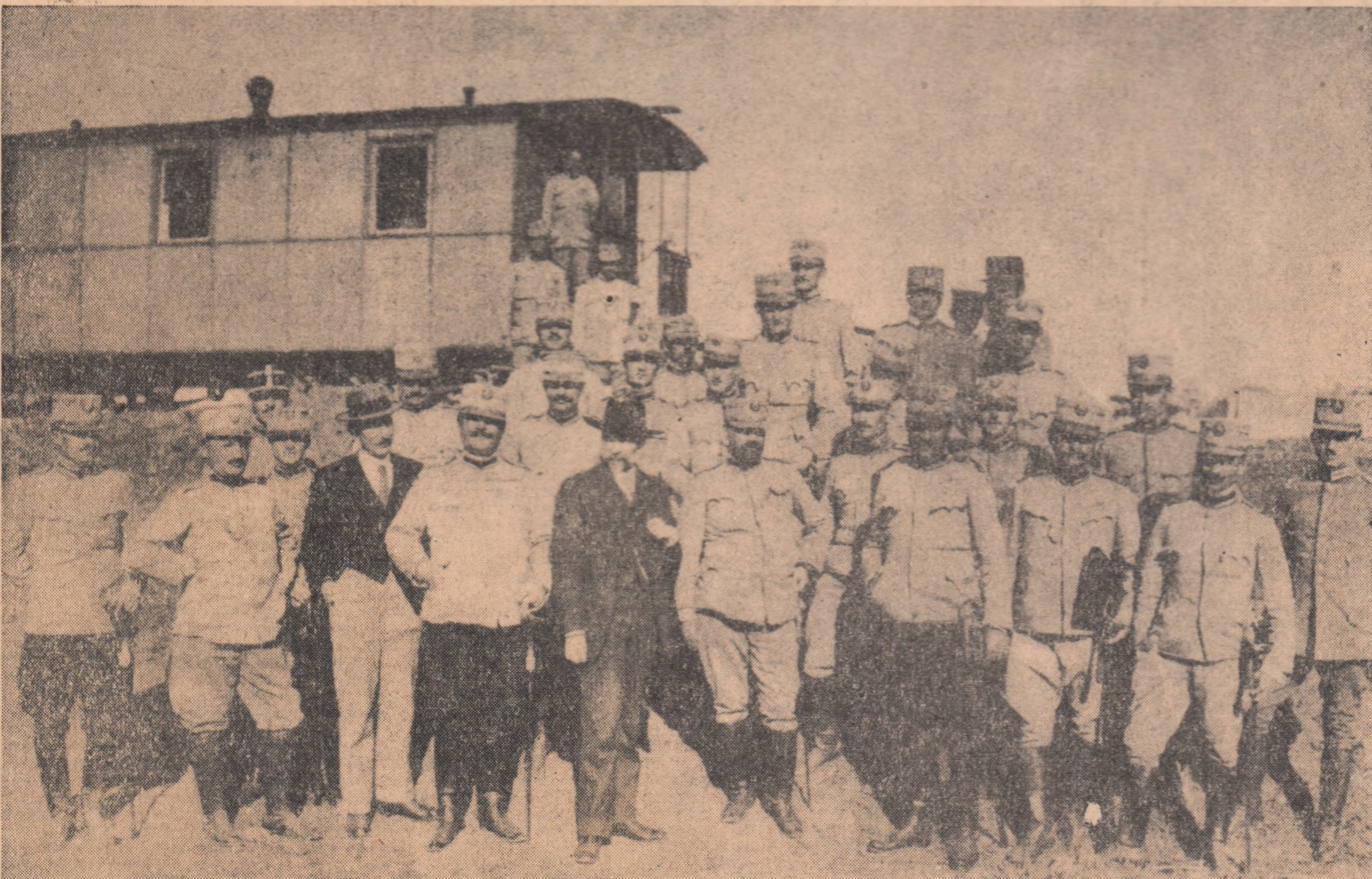
Fotografie mai puțin cunoscută: G. Coșbuc într-un grup de medici militari, la o unitate sanitară, în pregătirea primului război mondial.

G. Călinescu făcea observația că poetul Firelor de tort, nutrit mai ales cu literatură germană, cu legende și cu balade gotice, venea cu multe romantisme, dar și cu o structură spirituală care îl apropia de „mîncătorul de oameni” al lui Delavrancea și Brătescu-Voinești.